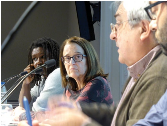
Diferents moments de les taules rodones que van tenir lloc durant la Jornada sobre la Precarietat Laboral.

gats d'informar de les tarifes que paguen als seus col·laboradors. I que els lectors, espectadors i oients jutgin el que paguen", va indicar Bernabé. "A les redaccions —va afegir— no saben el que paguen als col·laboradors. I crec que els comitès d'empresa haurien de defensar-los també".