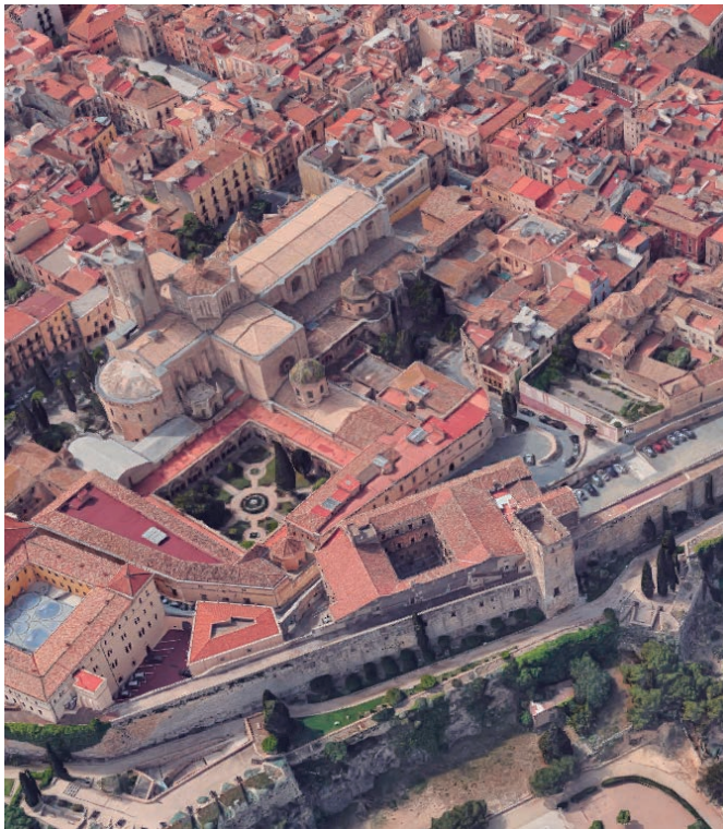
A la Part Alta és on hi ha més elements arqueològics per protegir.