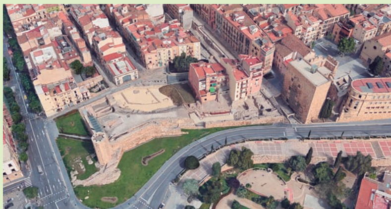
Imatge aèria que mostra la convivència entre les restes de Tarraco i l'actual ciutat.