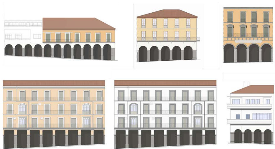
Figura 4 Hipótesis cromáticas de las fachadas según determinación de colores en muestras extraídas

Con todo este trabajo se comprobó que, efectivamente, las pinturas originales de los paramentos eran minerales, de colores beige y terrosos; las de las carpinterías correspondían a masillas de colores verdes oscuros, grises o beige; y que las barandillas habían sido pintadas, en origen, con pinturas al óleo de varios colores. Se determinaron los colores originales de cada elemento de la fachada y se analizaron posteriormente las gamas cromáticas que pertenecían a cada tipología estilística para poder extrapolar los resultados a los 127 edificios de la calle. De esta manera, todos los edificios fueron clasificados según la tipología previamente definida, a partir de aspectos como la composición de la fachada, la presencia de elementos decorativos, etc.