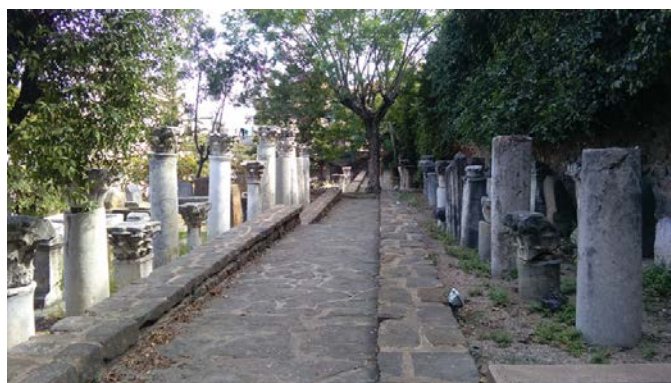
Figura 2 Conjunto de restos de época romana conservados en el museo al aire libre de la ciudad

Para poder realizar el estudio cromático fue imprescindible realizar, previamente, un Estudio Histórico de la ciudad y específicamente una investigación detallada de la calle Didouche Mourad. El estudio tenía como objetivos fundamentales analizar e interpretar los hechos y contextos que determinaban la secuencia histórica de la configuración de la calle y los edificios desde la fundación de Philippeville hasta la actualidad.