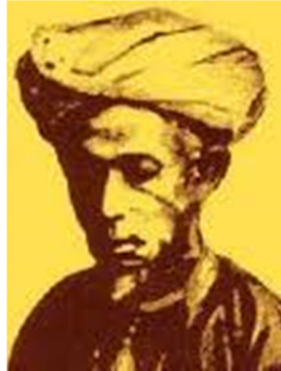
Raja Ali Haji