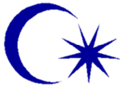
Bendera Sultan Johor