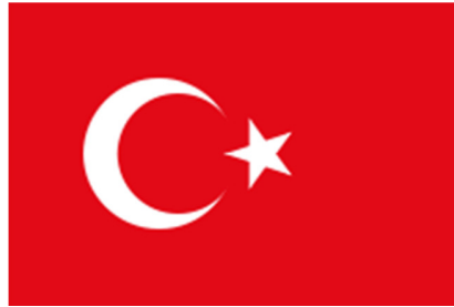
Bendera Kerajaan Riau Lingga