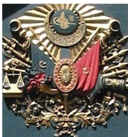
Darjah kebesaran Khilafah Othmaniyyah

Penubuhan sekolah-sekolah agama kerajaan Johor juga mempunyai persamaan dengan Maktab Othmani di Turki. Kitab-kitab rujukan seperti Matla`al Badrain yang digunakan di sekolah-sekolah agama Johor adalah terjemahan dari kitab-kitab di Maktab Othmani Turki.