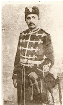
Raja Ali Kelana of Johor

Nama lengkapnya Raja Ali Kelana bin Sultan Muhammad Yusuf al-Ahmadi (Yamtuan Muda ke-10, 1858 Masihi - 1899 Masihi) bin Raja Ali (Yamtuan Muda ke-8, 1844 Masihi - 1857 Masihi) bin Raja Jaafar (Yamtuan Muda ke-6, 1808 Masihi - 1832 Masihi) bin Raja Haji asy-Syahidu fi Sabilillah (Yamtuan Muda ke-4, 1777 Masihi - 1784 Masihi) bin Upu Daeng Celak (Yamtuan Muda ke-2, 1729 Masihi - 1746 Masihi). Daripada nama-nama tersebut dapat disimpulkan bahawa lima orang Yamtuan Muda mulai ayah hingga ke atas adalah pertalian lurus pada Raja Ali Kelana. Raja Ali Kelana tidak sempat menjadi Yamtuan Muda kerana kerajaan