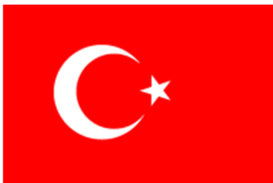
Bendera Khalifah Othmaniyyah

Beberapa bukti hubungan di antara Khilafah Othmaniyyah dan Johor ialah persamaan bendera dan lambang kedua negara dan hanya berbeza pada warnanya.