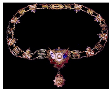
Darjah kebesaran Johor

Anugerah gelaran "Sultan" kepada Sultan Abu Bakar adalah pemberian Khilafah Othmaniyyah semasa lawatan baginda ke Turki pada tahun 1866. Sebelum itu Khilafah Othmaniyyah juga telah memakaikan gelaran Sultan kepada Sultan Melaka sebagaimana dicatatkan di dalam Buku "Hikayat Hang Tuah", iaitu Sultan Muzaffar Shah telah menghantar