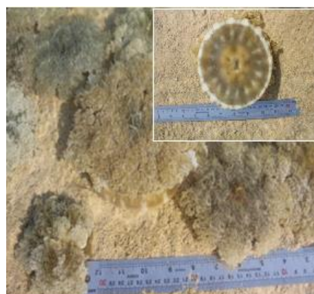
شکل ۲) نمونه زنده عروس دریایی C. andromeda در خلیج نابیند، بوشهر - ایران.