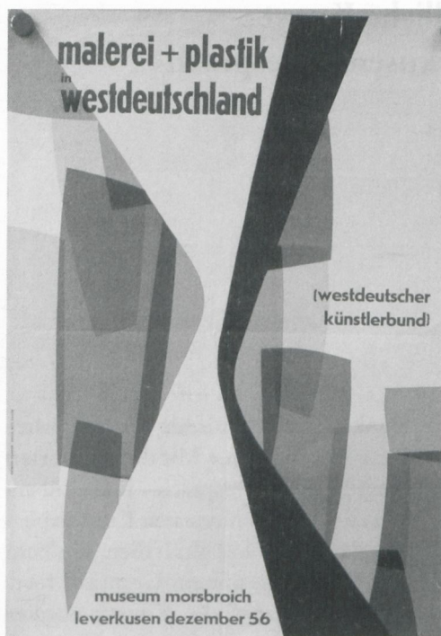
1 Ausstellungsplakat Malerei und Plastik in Westdeutschland – 1956 , Museum Morsbroich, Leverkusen 1956/57