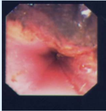
Abb. 2 ▲ Ösophagusmukosa mit deutlicher Verfärbung nach Entfernung der Knopfbatterie