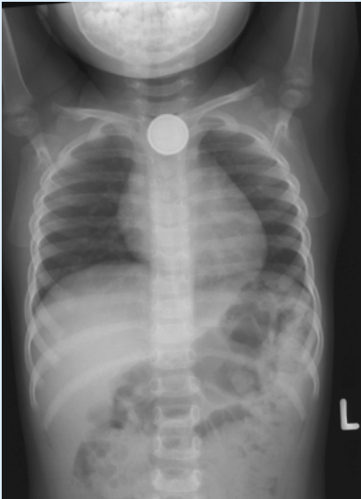
Abb. 1 ▲ Röntgen-Thorax a.p. mit Fremdkörper: Knopfbatterie im Ösophagus auf Höhe der Aortenenge mit typischer Doppelkontur