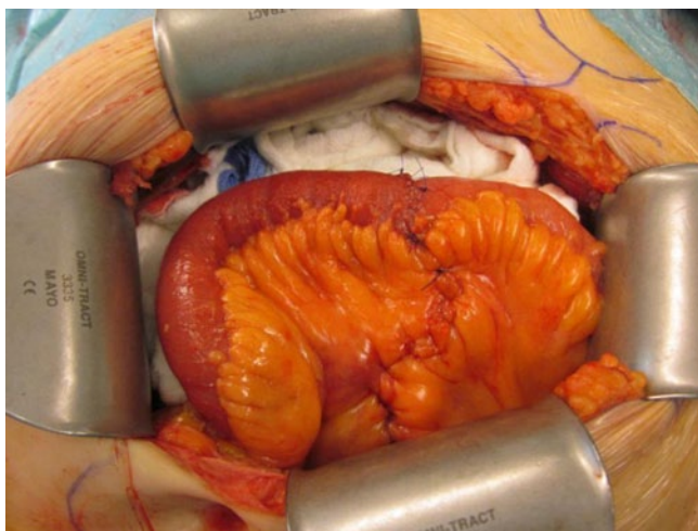
Abb. 2 ◀ Segmentresektion und Wiederherstellung der Dünndarmkontinuität

konnte nachgewiesen werden, dass die Verwendung der CTA in der präoperativen Diagnostik eine statistisch signifikante Senkung der Mortalitätsrate zur Folge hat [2].