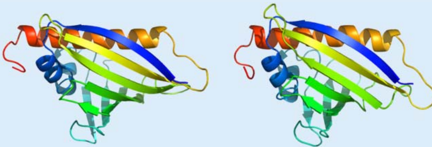
Abb. 2 ▲ Hohe Strukturhomologie (energieminimierte Strukturen) des Majorallergens der Birkenpollen Bet v 1 (links) und des homologen Nahrungsmittelallergens in Kirsche Pru av 1 (rechts)

kation erfuhren. Zudem zeigten die läsionären T-Lymphozyten der Patienten mit einer positiven Nahrungsmittelprovokation eine verstärkte Immunantwort auf Birkenpollenallergene. Diese Resultate sind hochinteressant, müssen jedoch in Zukunft an größeren Patientenkollektiven bestätigt werden.