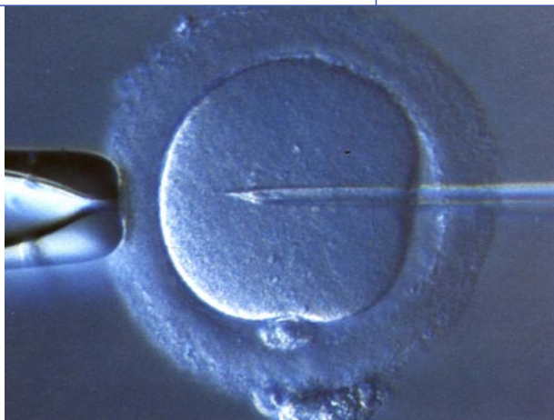
Abb. 1 ◀ Intrazytoplasmatische Spermieninjektion (ICSI)

SI-Kinder gegen spontan gezeugte Kinder oder IVF und ICSI-Kinder gemischt gegen spontan gezeugte Kinder. Hier ist vorwegzunehmen, dass sich die meisten Studien auf Malformationen nach ICSI beschränken und die Datenlage bezüglich Malformationen bei IVF-Kindern sehr beschränkt ist. Im Vergleich von IVF zu Spontankonzeption gibt es eigentlich nur die Daten von Hansen et al. [20], die den heutigen Ansprüchen an ein gutes Studiendesign genügen. Daraus geht hervor, dass sich das Risiko einer Malformation nach IVF nicht von dem Risiko nach ICSI unterscheidet. Paare, bei denen eine IVF vorgesehen ist, sollten nach heutiger Datenlage also gleich beraten werden wie Paare, bei denen eine ICSI vorgesehen ist.