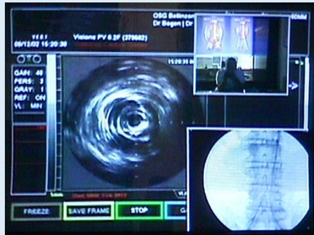
Abb. 3 ▲ Telemontoring zwischen dem Operationssaal in Bellinzona, Tessin, und dem Mentor in Lausanne, Waadt (kleines Bild oben rechts): Distanz auf der Straße (via Gotthard-Tunnel)=355 km! Das Bild im Zentrum wurde mit dem IVUS (heute Vulcano) im Tessin generiert und zeigt die Endoprothese in der Aorta (zirkuläre Ringe). Das Bild unten rechts stammt vom Bildverstärker des C-Bogens im Tessin. Man erkennt die Wirbelsäule und die davor verlaufenden aortoiliakalen Führungsdrähte