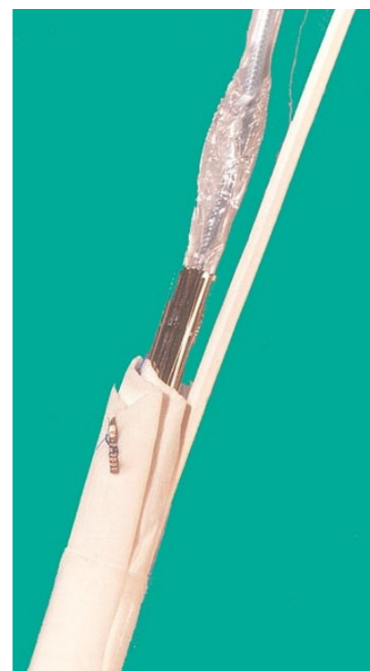
Abb. 1 ▲ Eine selbst gefertigte, mit PTFE abgedichtete Endoprothese ragt mit einem Ballon und einem Führungskatheter aus einem Einführungsbesteck

Forschungsprojekte mit dem Fokus Stenttherapie die zukünftige Entwicklung von Therapie und Lehre nachhaltig beeinflussen werden.