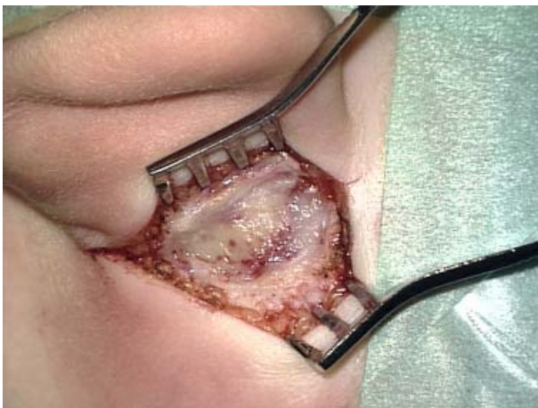
Abb. 3 ◀ Intraoperative Aufnahme der Abszesskapsel unmittelbar subkutan. Haut und Subkutis selbst sind auffallend reizlos. Nach Eröffnung entleerte sich rahmiger Eiter

brochenem, gut abgekapseltem Abszess (◻ Abb. 3 ). Die histologische Aufarbeitung des intraoperativ entnommenen Materials ergab Granulationsgewebe mit teils akuter eitrig-er Entzündung, in der mikrobiologischen Kultur wurden Pneumokokken nachgewiesen. Drei Tage postoperativ konnte die retroaurikuläre Drainage gezogen und das Mädchen bei gutem Befinden nach Hause entlassen werden. Eine antibiotische Therapie mit Amoxicillin/Clavulansäure wurde während 3 Tagen intravenös und dann für weitere 7 Tage peroral verabreicht. In den 14 Monaten postoperativ ist bisher keine Otitis mehr aufgetreten, die Stellung der Ohrmuscheln wurde wieder symmetrisch.