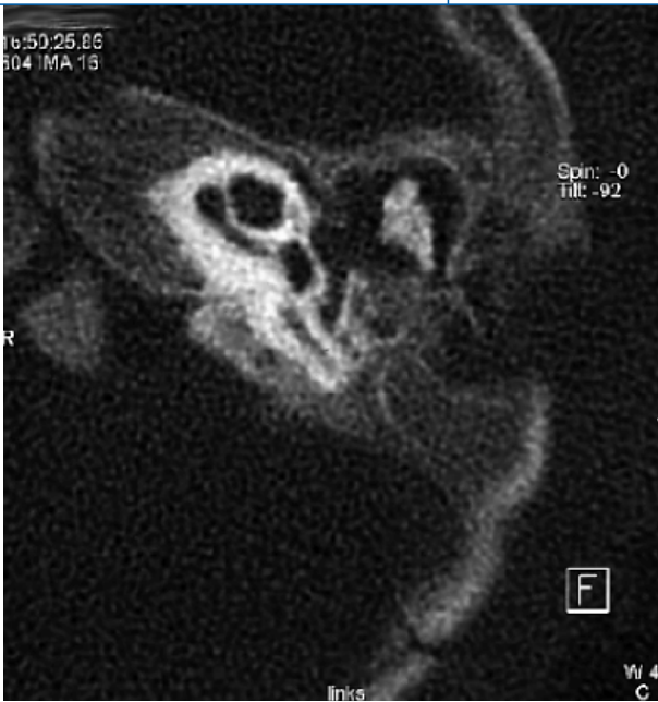
Abb. 1 ◀ Osteolytischer Prozess im linken Mastoid mit Auflösung der Tabula externa und vollständiger Verschattung im Mittelohr