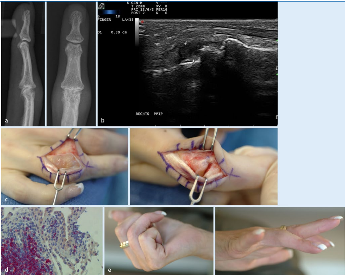
Abb. 1 ▲ Befunde einer rheumatoiden Arthritis mit beginnender Zerstörung des PIP-Gelenks a radiologisch und b ultrasonographisch: PIP-Gelenk von palmar (Synovialitis schon im Frühstadium konsistenter darstellbar). Aufgrund der schmerzlosen Bewegungseinschränkung entschied man sich nur zur Synovektomie: c Intraoperativer Befund vor und nach der Synovektomie. d Histologisch entsprach der Befund einer RA [Zottenbildung, mehrschichtige Deckzellen und lymphoide Infiltrate. Mit Hilfe eines markierten Antikörpers wurden die CD20-exprimierenden B-Lymphozyten angefärbt (rotes Zytoplasma)]. e Das funktionelle Ergebnis 5 Wochen postoperativ ist für die Patientin sehr zufriedenstellend