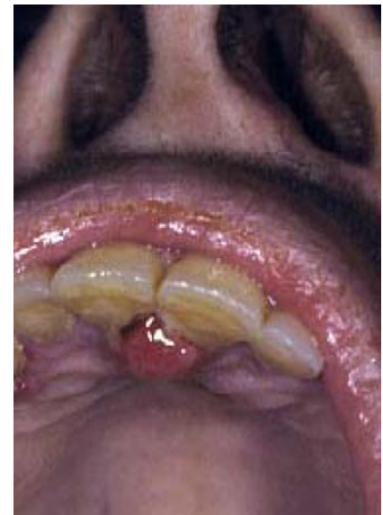
Abb. 1 ▲ Mundschleimhautmetastasen eines Bronchialkarzinoms

Ausgeschlossen wurden alle Patienten mit Hautmetastasen bei primär kutanem Malignomen (24 Patienten mit malignem Melanom und 1 Patient mit Spinaliom). Patienten, deren klinisch eindeutige