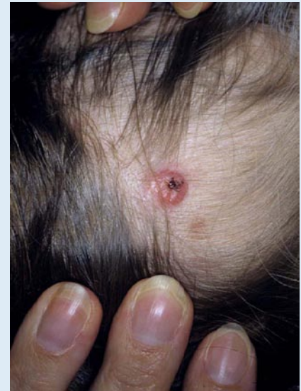
Abb. 5 ▲ Kleine brettharte noduläre, zentral exulzerierte Hautmetastase am Skalp bei Epitheloidzellsarkom