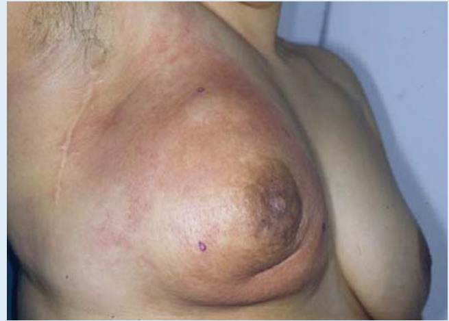
Abb. 9 ▲ Flächig maligne infiltrierte und indurierte Haut mit inflammatorischem Aspekt bei Mammakarzinom