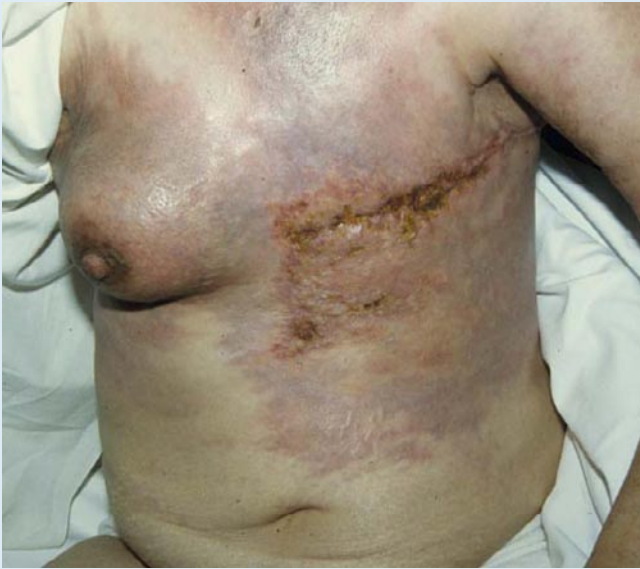
Abb. 8 ▲ Cancer en cuirasse bei Mammakarzinom