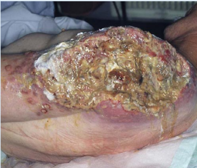
Abb. 10 ▲ Ulzerierende Metastase eines Hypopharynxkarzinoms