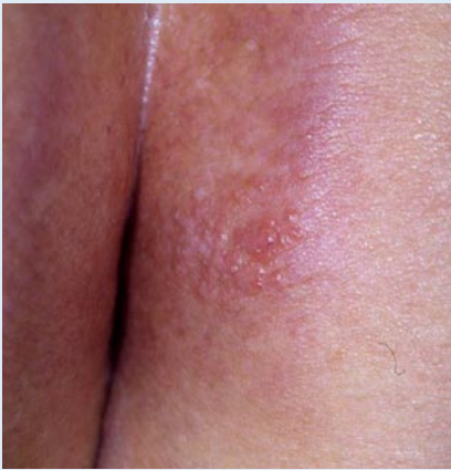
Abb. 4 ▲ Metastasen eines Kolonkarzinoms