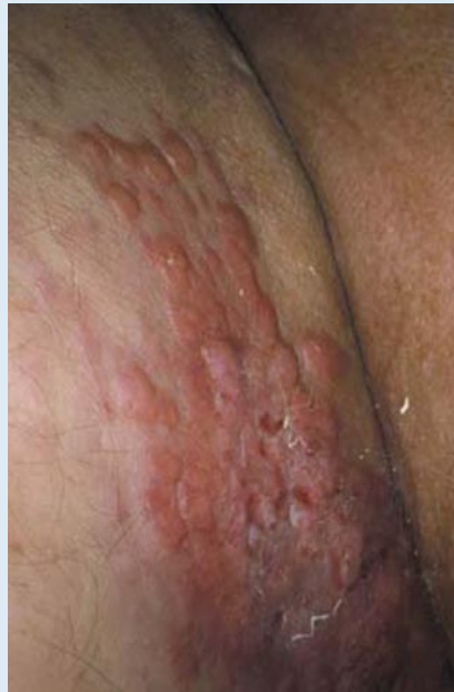
Abb. 3 ▲ Metastasen eines Prostatakarzinoms