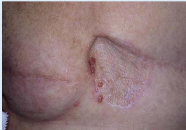
Abb. 6 ◀ Großflächig maligne infiltrierte gerötete Haut der Brust- und Bauchwand mit nodulären und vesikulösen Anteilen und 2 exophytischen Tumoren bei Mammakarzinom