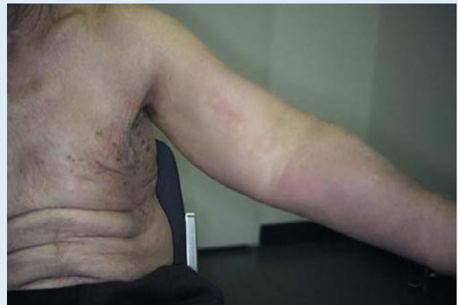
Abb. 11 ▲ Lymphödem des linken Arms bei Mammakarzinom eines Mannes links mit nodulären Hautmetastasen pectoral und axillär links

das Pankreas, die Nieren und das Peritoneum.