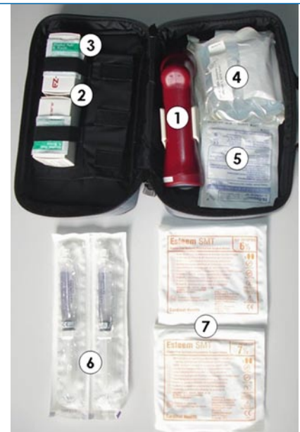
Abb. 7 ▲ Intraossäres Infusionsset, bestehend aus: 1 1-mal EZ-IO-Handbohrmaschine in Halterung, 2 2-mal EZ-IO-Intraossärkanüle für Kinder ab 3 kgKG (15 G, 15 mm), 3 4-mal Desinfektionstüpfel, 4 1-mal intraossäre Kanüle, Modell Cook 18 G mit Dieckmann-Modifikation für Kinder <3 kgKG, 5 2-mal Infusionsanschlussleitungen (gewinkelt), 6 2-mal 10-ml-Fertigspritzen mit 0,9%iger Kochsalzlösung, steril verpackt, 7 2-mal sterile latexfreie Handschuhe (Gr. 6,5/7,5)

Gelegentlich wird intramuskulär verabreichtes Ketamin (oder S-Ketamin) zur