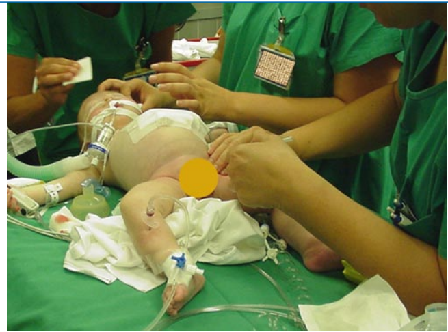
Abb. 5 ► 15-G-EZ-IO®-Intraossärkanüle (15 mm) in der rechten proximalen Tibia eines 15-jährigen Knaben (15 kgKG) mit schwerer spastischer Zerebralparese sowie schwierigsten Atemwegs- und Venenverhältnissen

Abb. 4 ► Anlage einer 18-G-Cook®-Intraossärkanüle bei einem 9 Monate jungen Knaben mit Laryngospasmus bei bekannten funktionellen Atemwegsproblemen und diversen Dysmorphien, bei dem eine PEG-Sonde in Intubationsanästhesie eingelegt werden sollte