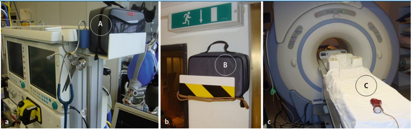
Abb. 8 ▲ Intraossäre Infusionssets. a Angebracht an jedem Anästhesiearbeitsplatz, b einschließlich des MRT-Raums, c im MRT an einer Sicherheitsleine angebrachte Bohrmaschine

tionsrate aus der Notfallmedizin noch niedriger erwartet werden. Damit ist die kontrollierte intraossäre Einleitung weniger risikoreich als die inhalative oder intramuskuläre Einleitung eines nichtnüchternen, schreienden Kindes in den Händen eines mit Kindern wenig vertrauten Anästhesisten.