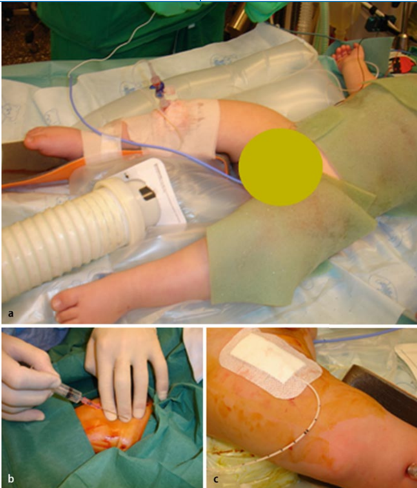
Abb. 6 ▲ Zweijähriger Knabe mit ausgedehnten Verbrühungen an Rumpf und Extremitäten zur Primärversorgung (Debridement und Verband). a 18-G-Cook®-Intraossärkanüle am rechten proximalen Unterschenkel zur präoperativen Schmerz- und Flüssigkeitstherapie. b, c Weitere Flüssigkeitssubstitution und Analgosedierung mit Midazolam und Ketamin via Intraossärkanüle, bevor ein zentralvenöser Katheter in die rechte Femoralvene eingelegt werden konnte; anschließend umgehende Entfernung der Intraossärkanüle

Intraossärkanüle an der linken proximalen Tibia angelegt. Nach Volumensubstitution mit kristalloiden und kolloidalen Lösungen wurde die Anästhesie intraossär mit Ketamin und Atracurium eingeleitet. Anschließend erfolgte die Gabe von ungetestetem 200 ml Erythrozytenkonzentrat der Gruppe o, Rh-neg. durch die Intraossärkanüle. Nach erfolgter operativer Blutstillung wurde ein zentralvenöser Katheter in die V. jugularis interna rechts eingelegt und die Intraossärkanüle entfernt.