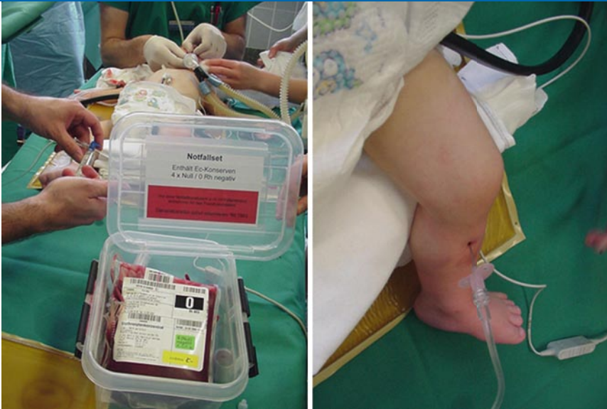
Abb. 3 ▲ Notfallmäßige Anlage einer 18-G-Cook®-Intraossärkanüle bei einem 18 Monate jungen Knaben mit akuter Blutung aus der A. palatina am zehnten postoperativen Tag nach Verschluss des harten Gaumens

MRT verwendet werden, wenn sie, wie andere magnetische Geräte und Gegenstände, mit einer Sicherungsleine für die Einhaltung des minimalen Sicherheitsabstands zum Tomographen ausgestattet ist.