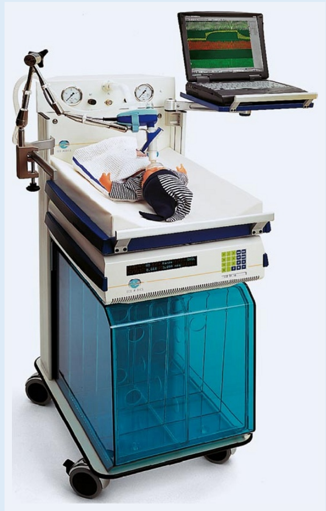
Abb. 2 ▲ Gerät zur Durchführung von „Multiple-breath-washout-Messungen“. Mit dieser Methode kann sowohl das Lungenvolumen ( FRC ) als auch die Gasverteilung ( LCI ) bestimmt werden

lichste Parameter der Ventilationshomogenität ist der sog. „Lung-clearance-Index“ ( LCI ), der gleichbedeutend ist mit der Anzahl von Atemzügen, die benötigt werden, um die FRC komplett aus der Lunge auszuwaschen. Während schon länger bekannt ist, dass der LCI bei älteren Kindern mit Mukoviszidose ( CF ) deutlich sensitiver den Zustand der Erkrankung anzeigt als herkömmliche Lungenfunktionsparameter, wie z. B. FEV_1 [21], gibt es neuere Ergebnisse, die darauf hinweisen, dass die Gasverteilung bei CF -Patienten schon im Säuglingsalter gestört ist [23]. Auch bei Frühgeborenen mit CLD scheint die Inhomogenität der Gasverteilung ein wichtiger Marker für die Lungenentwicklung zu sein und ist möglicherweise von Nutzen für die Progno-