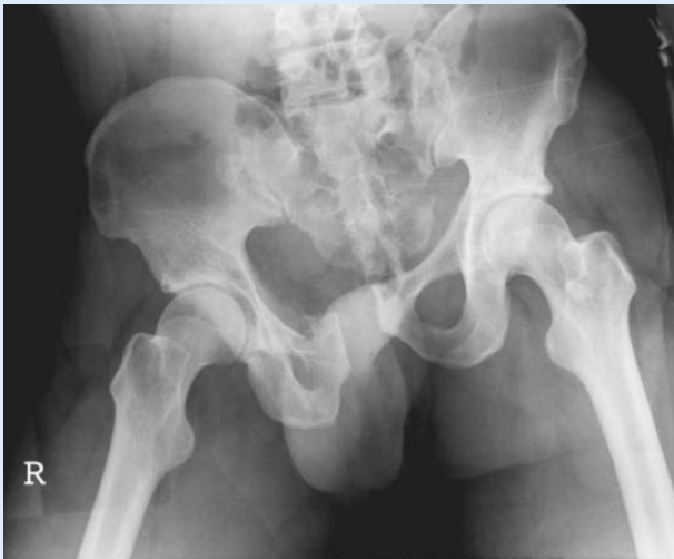
Abb. 3 ▲ Präoperative Beckenübersichtsaufnahme: 34-jähriger Patient nach Überrolltrauma, instabile Beckenringverletzung Typ C („vertical shear“) mit transforaminaler Sakrumlängsfraktur, Symphysensprengung und oberer/unterer Schambeinastfraktur