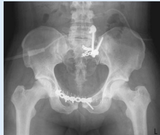
Abb. 5 ► Definitive operative Stabilisierung: iliolumbale Transfixation und Plattenosteosynthese der Sakrumfraktur. Plattenosteosynthese des vorderen Beckenrings