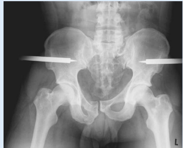
Abb. 4 ▲ Beckenübersichtsaufnahme nach geschlossener Reposition: suprakondyläre Femurextension links mit 10 kg und Fixation des hinteren Beckenrings mit Beckenzwinge