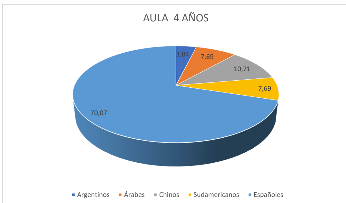
Gráfico sobre los alumnos de 4 años y porcentaje de sus respectivas nacionalidades.