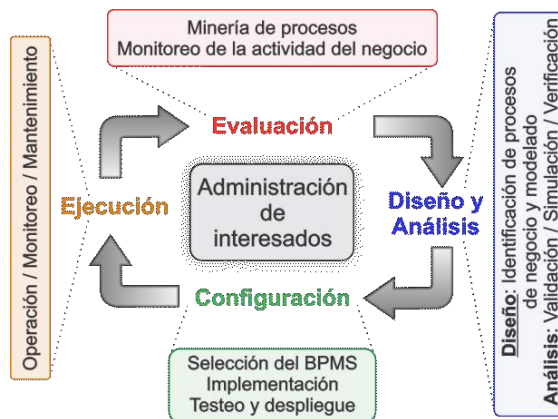
Fig. 1: Ciclo de vida de BPM [4].

se especifican aspectos necesarios y se implementan para que los modelos de procesos puedan ser interpretados por un sistema de gestión de procesos de negocio (BPMS, del inglés Business Process Management System ). En la fase de ejecución, el BPMS permite la ejecución de los procesos configurados mediante un motor de procesos . Finalmente, en la fase de evaluación se analiza el resultado de la ejecución para identificar problemas y aspectos que puedan ser mejorados [5].