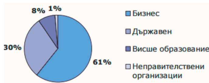
Рис. 3. Структура витрат на НДДКР у Болгарії за галузями, 2013 р.

У 1996 р. почав діяти Бізнес-центр-Русе в м. Русе з фінансовою допомогою Делегації Європейської комісії та програми EURADA-PHARE. Центр надавав послуги з бізнес-консультування, організації семінарів, курсів для навчання, допомоги під час підготовки бізнес-планів.