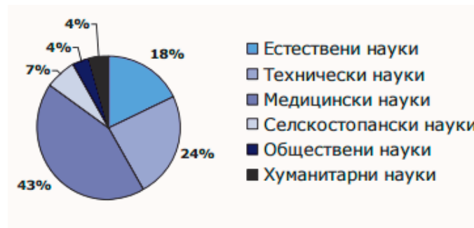
Рис. 2. Структура витрат на НДДКР у Болгарії за науковими напрямками, 2013 р.