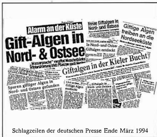
Schlagzeilen der deutschen Presse Ende März 1994

Algenblüten sind auch in den deutschen Küstengewässern kein neues Naturphänomen, werden aber erst seit Ende der achtziger Jahre mit zunehmender Sorgfalt registriert. So sind toxische Algenblüten im Bereich der Deutschen Bucht verbunden mit diarrhöischer Muschelvergiftung (DSP) seit 1986 ein dokumentiertes, regelmäßig wiederkehrendes Phänomen, welches vermutlich allein auf Vertreter der Dinoflagellaten-Gattung Dinophysis zurückzuführen ist (Nehring et al. 1994). Ein außergewöhnlicher Fall ereignete sich im Jahre 1990, wo die bisher in Europa nur aus der Ostsee bekannte toxische Cyanophycee Nodularia spumigena im Banter See, einem öffentlichen Brackwasser-Badesee im Stadtgebiet von Wilhelmshaven, zur Massenblüte