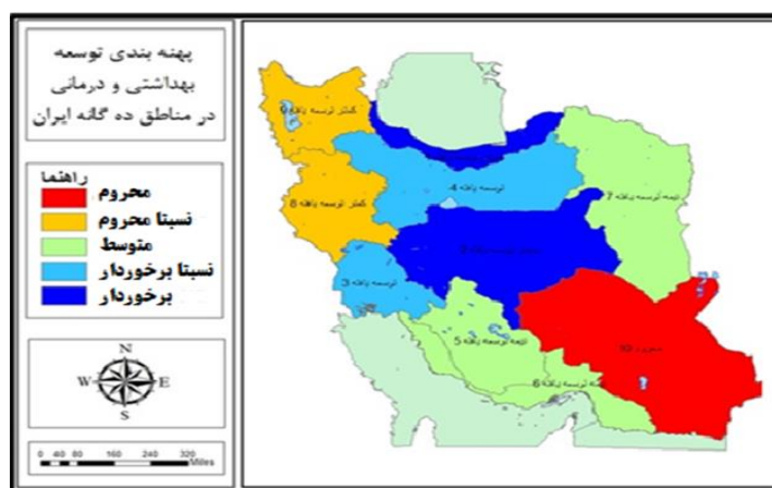
شکل ۲: پهنه‌بندی کلان مناطق کشور با مدل تاپسیس