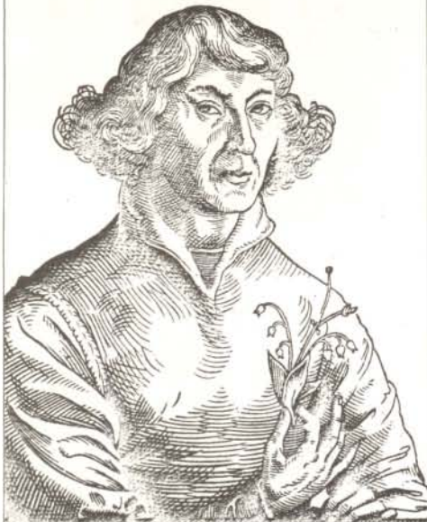
fig. 1 Nicolau Copèrnic (1473-1543)