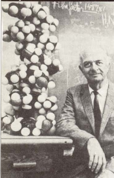
Una representació esquemàtica en doble hèlix del DNA. Linus Pauling va proposar el 1951 la estructura en hèlix- \alpha com a estructura secundària de les proteïnes, gràcies a la utilització dels models d'escala.

vestigació en biologia molecular en diferents centres de recerca britànics i nord-americans. L'any 1962 li va ser concedit el premi Nobel de fisiologia i medicina, compartit amb J.D. Watson i M.H. Wilkins, pels seus treballs sobre l'estructura molecular de l'DNA. És autor, a més, de diferents obres de divulgació científica.