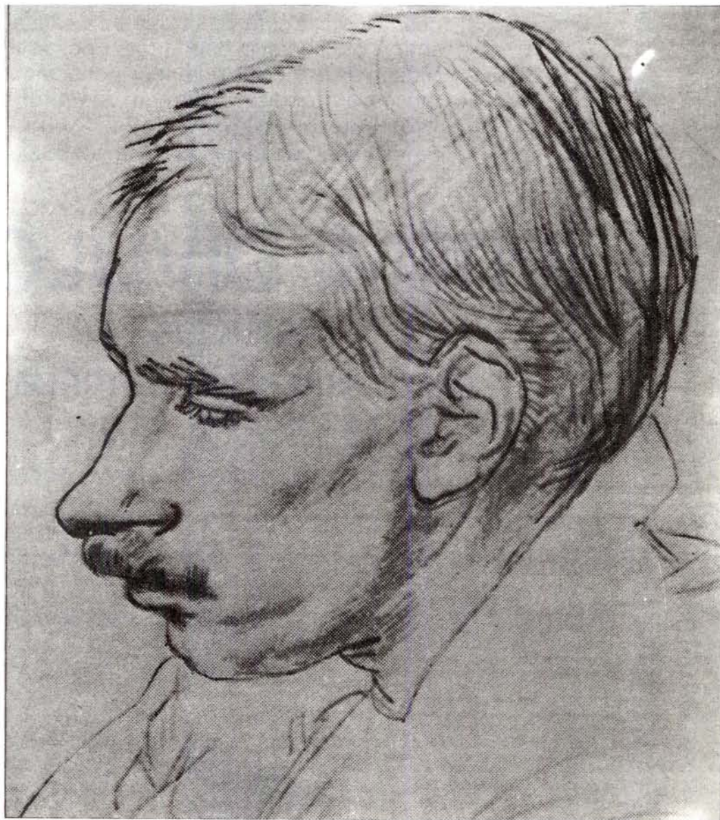
Fig. 1 John Maynard Keynes (1883-1946)