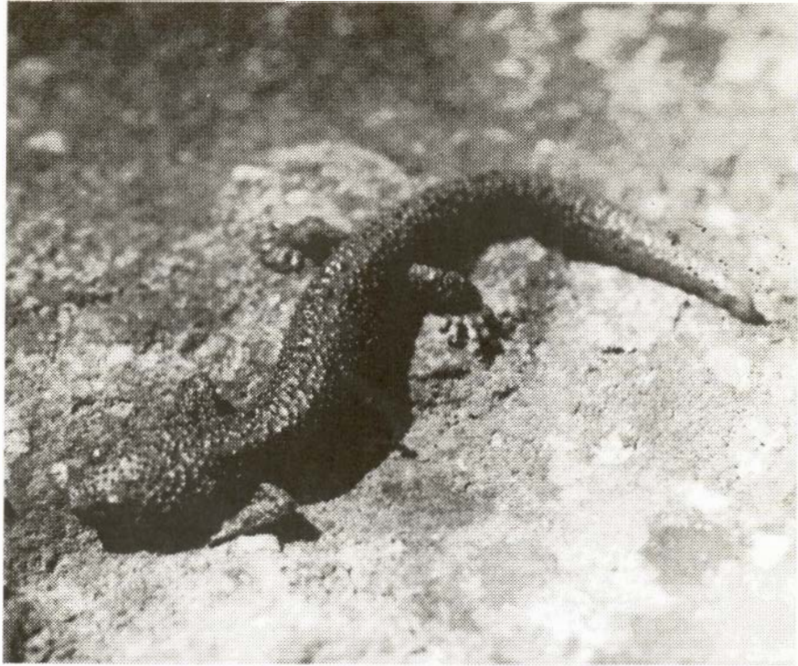
Tritó pirinenc ( Euproctus asper ).

daix verd Lacerta viridis a la zona, tal com assenyala Vives-Balmaña (1982-1984), és d'especial significació, ja que aquest fet deixaria obertes les portes a altres espècies pròpies de la Catalunya oriental humida.