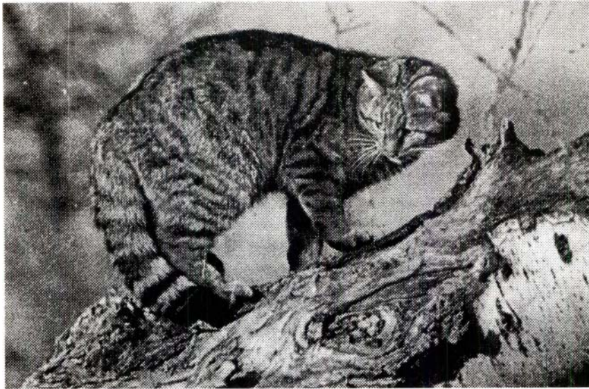
Gat salvatge ( Felis sylvestris ).

Montsant, també es troba molt amenaçada). Cal assenyalar que, si bé en nombre molt més reduït, també la trobem a l'àrea de Terradets a la Noguera Pallaresa. La presència de l'embassament de Camarasa, la carretera C-147 i el ferrocarril han estat, indubtablement, els elements determinants del precari estat d'aquesta població. Per aquesta causa, hom considera totalment nefast l'efecte de la construcció d'una carretera al congost de Montrebei, ja que facilitaria la penetració humana (i, per tant, molèsties, persecució, etc., en una àrea de característiques molt feréstegues), i l'abocament dels materials sobrants al riu, la qual cosa destruiria l'hàbitat de la llúdriga.