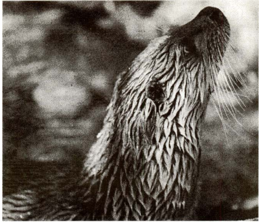
Llúdriga ( Lutra lutra ). Espècie protegida en greu perill d'extinció.

Per concloure aquest apartat, hem d'indicar l'extrema pobresa de la fauna ungulada (artiodàctils) que viu a l'àrea (tan sols el senglar). Els cèrvids (cèrvol Cervus elaphus , i cabirol, Capreolus capreolus ) van ser extingits ben aviat; darrerament han estat trobats documents del segle XV en els quals es parla de la presència de cèrvols a la serra. També fou possible, en temps passat, la presència de la cabra salvatge ( Capra pyrenaica ) o, àdhuc, més recentment, de l'isard ( Rupicapra pyrenaica ). L'esmentada pobresa d'ungulats no ha de restar importància a l'àrea, ja que és una pobresa estesa a gran part de Catalunya i només l'actuació de l'Admi-