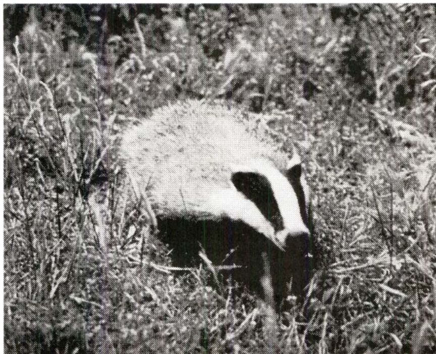
Teixó (Meles meles).

condicionada en bona part per l'orografia ben peculiar de la serra, actua també potenciant la riquesa faunística, imprimint-hi una bona dosi d'heterogeneïtat.