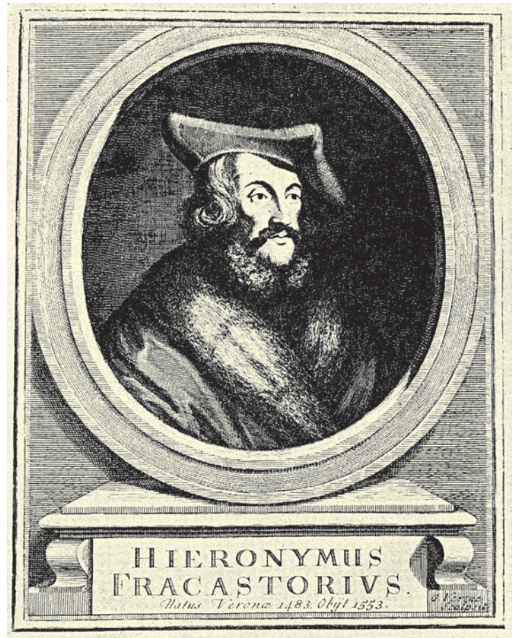
Retrat de Girolamo Fracastoro, el metge veronès que posà la terrible malaltia en vers i que li donà el poètic i immortal nom de sífilis.

Entretant, es prevenia contra noves maneres de contagi. El 1551, Antonio Brassavoli, a part de descriure 234 formes de la malaltia, alertava contra els perills d'atrapar-la a través de petons particularment intensos ( oscula cum vibratione et conflictu linguarum ). Quant a tractaments, l'ús del mercuri tendí a conciliar-se amb el del guaiac. Així, Thierry de Héry