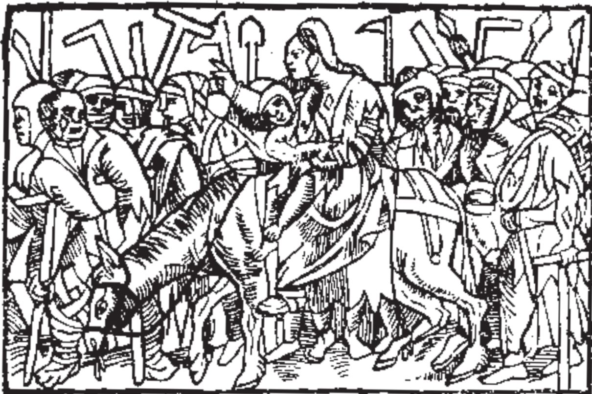
Es pot imaginar la retirada desastrosa de l'exèrcit de Carles VIII d'Itàlia com una gernació capitanejada per la mestressa del mal francès (o napolità, segons es miri). El gravat representa una processó moralitzant, i està extret del poema Le triomphe de haute et puissante dame Vérole (Lió, 1539).

Roma va ser un dels centres on es va dedicar més atenció al mal francès, o morbis gallicus , nom que ja havia esdevingut universal. En el seu estudi destacà el valencià Gaspar Torrella, metge del papa Alexandre VI, Roderic Borja. El 1497, Torrella publicà a Roma el seu Tractatus cum consiliis Pudendagram, seu morbum gallicum , que dedicà a Cèsar Borja, en el qual es congratulava de l'entorn tan favorable que havia tingut per a estudiar el mal francès, ja que en dos mesos li havia permès tractar 17 malalts sense sortir de les estances properes al papa. Un altre metge valencià, Joan Almenar, en el seu Libellus ad evitandum