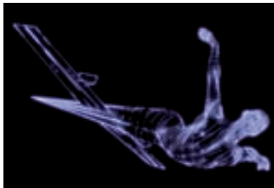
Marina Núñez. Sense títol, 2001. Sèrie Ciència-ficció. Pintura fluorescent sobre metacrilat.