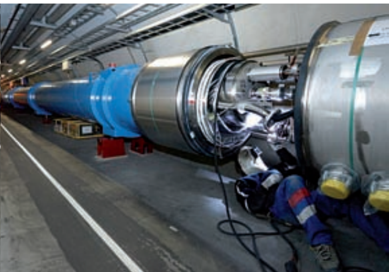
Detall de les connexions entre dos imants de l'LHC. Una fallada en una connexió com aquesta va provocar la fuga d'heli del 19 de setembre de 2008 que ha obligat a realitzar reparacions durant més d'un any abans de tornar a posar-lo en marxa.

Sol, la Lluna, els planetes del sistema solar, els nans blancs, etc. i no s'ha observat mai l'aparició de l'Armageddon en forma de forat negre, perquè, en cas contrari, la vida sobre la Terra hauria desaparegut fa temps i òbviament vostè, amic lector, no estaria llegint aquestes ratlles.