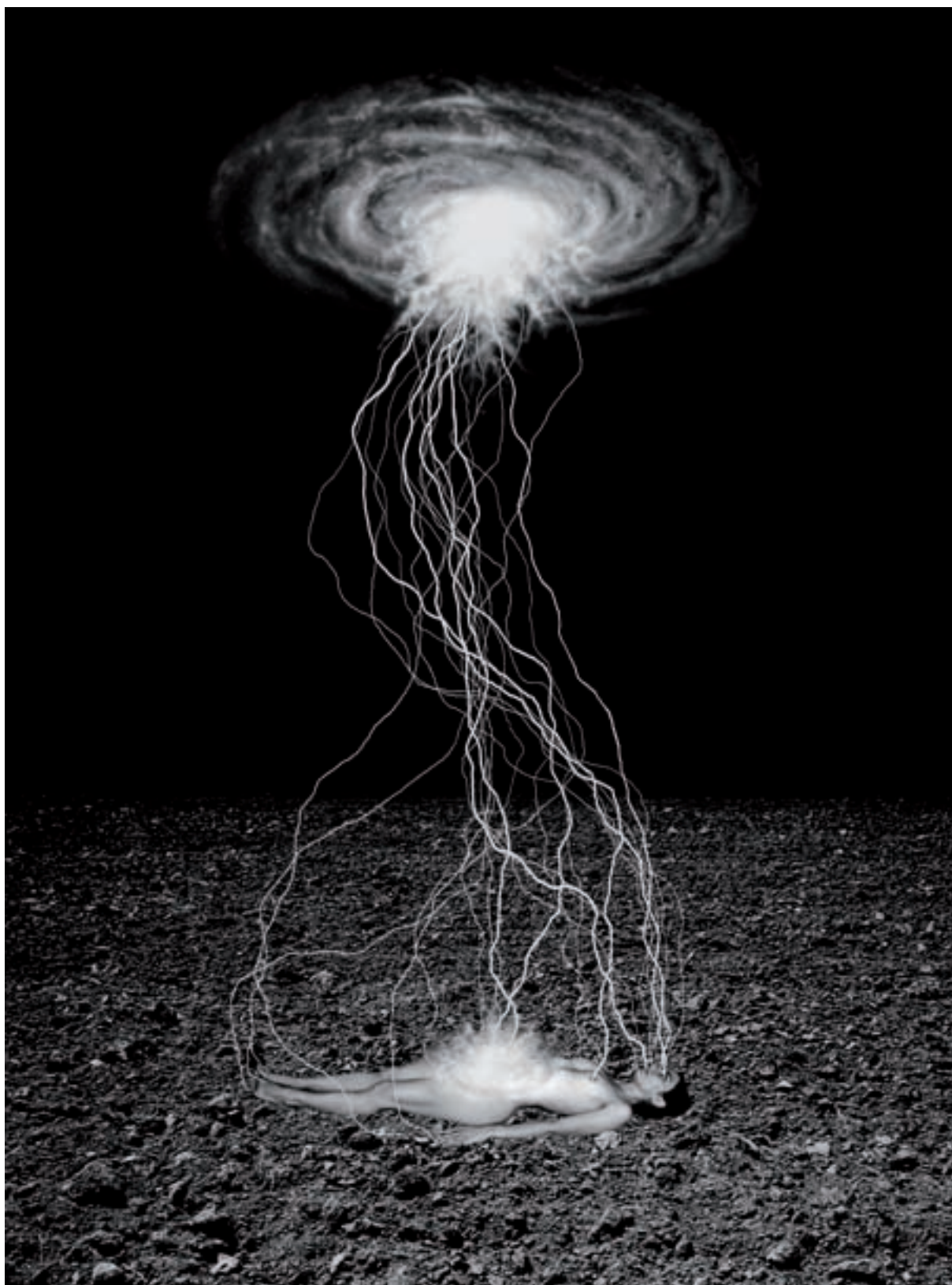
Marina Núñez. Sense títol , 2001. Sèrie Ciència-ficció. Infografia i retolador sobre paper, 67 x 48 cm.