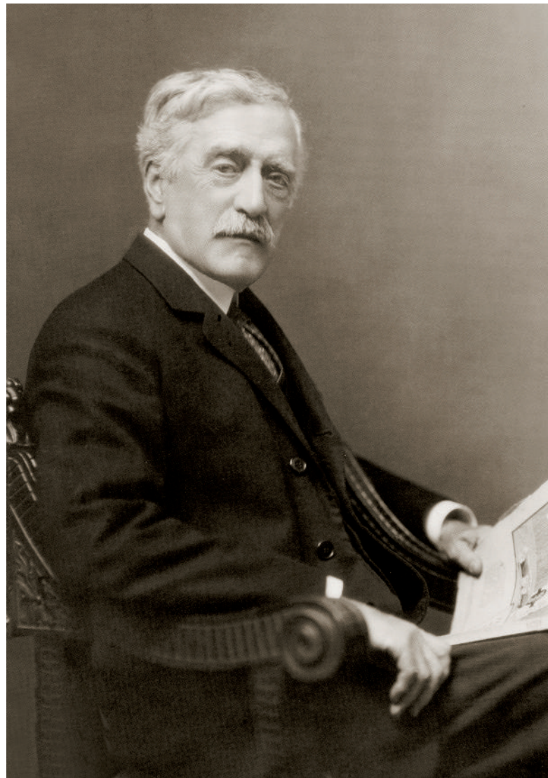
Ignacio Bolívar va arribar a Mèxic amb 89 anys i un prestigi internacional com a entomòleg. Va ser un dels naturalistes que Mèxic va acollir, dotant-lo d'un càrrec honorari i d'una pensió mensual.

D'altra banda, per a comprendre la integració dels refugiats necessitem conèixer el context sociopolític de Mèxic en el moment en què es va produir l'exili. En aquest sentit no podem deixar d'assenyalar l'autoritat del general Lázaro Cárdenas, president del país