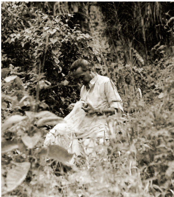
L'entomòleg Cándido Bolívar, recol·lectant insectes a Cuba, 1943.

comprendre's com a assumpte d'estat i com a promotora de progrés i de benestar, i per primera vegada en molt de temps es van albirar horitzons prometedors, en la mesura que es disposava ja d'alguns científics amb prestigi internacional disposats a lliurar-se a la posada en funcionament de nous centres d'investigació i a la formació de joves investigadors.