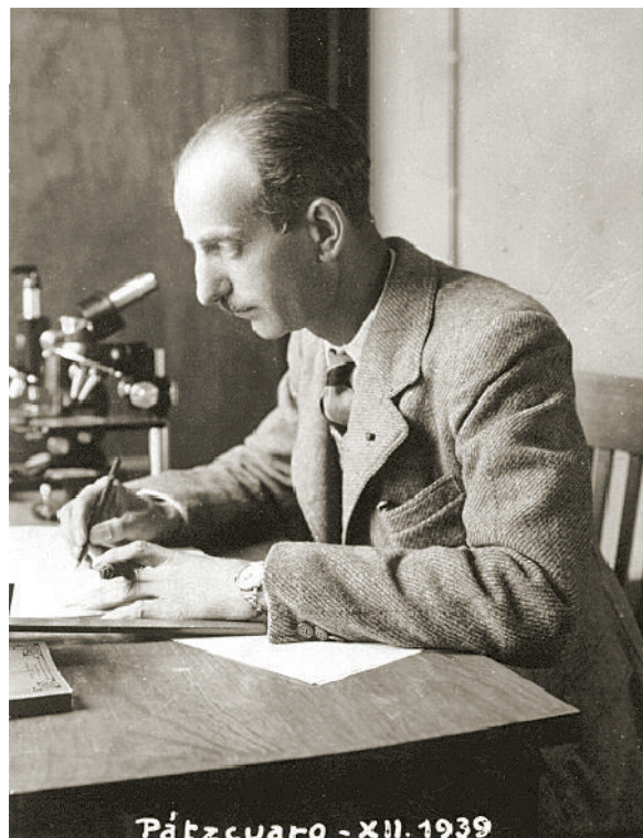
El biòleg marí Fernando de Buen al laboratori de l'Estació Limnològica de Pátzcuaro, a Mèxic, el 1939.

Finalment ens referirem breument a la participació dels naturalistes espanyols en comissions governamentals dels àmbits sanitari, pesquer i d'explotació dels recursos naturals. En el primer cal destacar els serveis pres-