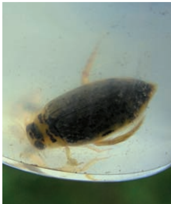
Els escarabats aquàtics són colonitzadors aeris, i alguns ditiscids són particularment eficients cercant i establint-se a nous ambients aquàtics. L'espècie de la fotografia ( Eretes griseus ) s'ha trobat a totes tres àrees estudiades, als pocs mesos de la inundació inicial.