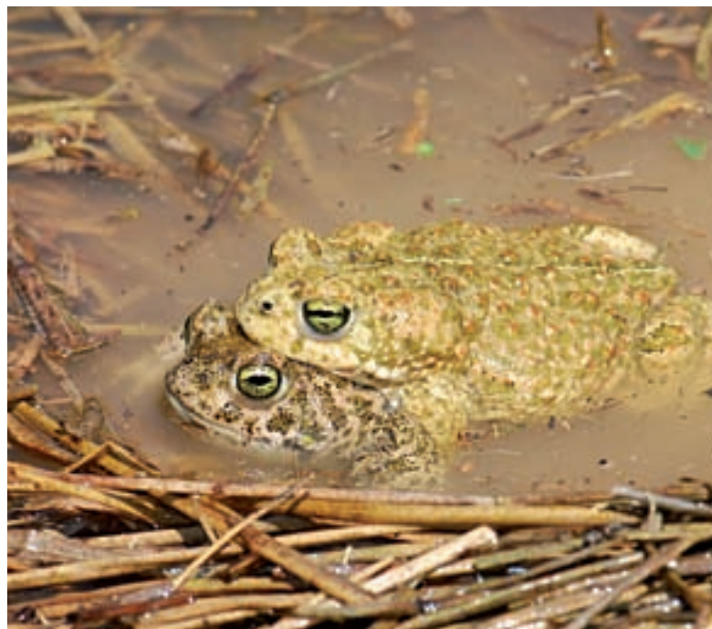
Els amfibis tampoc tarden a descobrir i aprofitar aquests ambients. El gripau corredor ( Bufo calamita ) s'ha reproduït en grans nombres a totes tres àrees estudiades ja la primavera següent a la inundació. A la fotografia, una parella en amplexus .

Altres exemples demostren que el temps juga a favor i per això molts projectes de conservació que no cerquen la immediatesa dels resultats inclouen estanys de nova creació, cada cop més sovint, com a element principal de la conservació de la biodiversitat. A més, cal fer no-