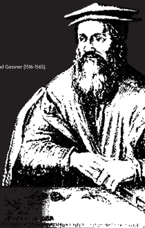
Konrad Gessner (1516-1565).

No obstant aquesta dedicació erudita, pròpia de l'interès per compendiar un coneixement que en el seu temps creixia espectacularment impulsat per l'expansió