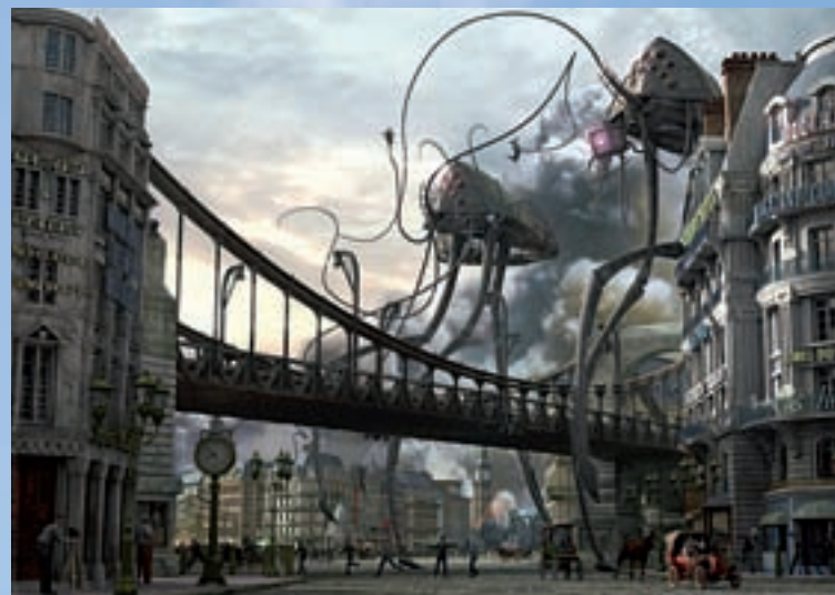
La novel·la d'H. G. Wells, La guerra dels mons , narra una invasió alienígena de la Terra. En la il·lustració, els trípod extraterrestres imaginats per Wells ataquen Londres.

«SEGONS HAWKING, CORREM EL RISC QUE, EN DELATAR LA NOSTRA PRESÈNCIA, ÉSSERS EXTRATERRESTRES VINGUEN A ENVAIR-NOS I A APODERAR-SE DELS NOSTRES RECURSOS, DESTRUÏNT EN EL PROCÉS LA RAÇA HUMANA»