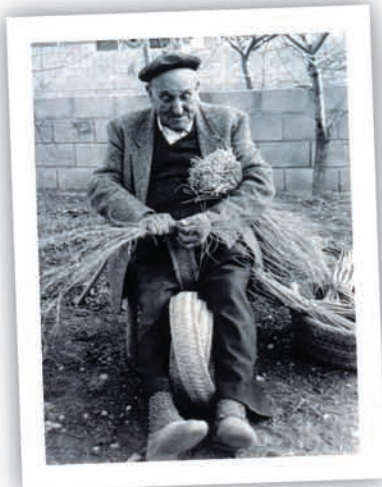
Fent llata d'espart a Biar (Col·lecció Museu Arqueològic Municipal d'Alcoi Camil Visedo).