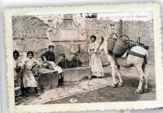
Dalt, sàries d'espart i cistelles de vímet a la font dels Algepsars d'Alcoi a l'inici del segle xx (Col·lecció Museu Arqueològic Municipal d'Alcoi Camil Visedo). A la dreta, cadira de boga i cadira d'espart a Olocou (Col·lecció Museu de Prehistòria i de les Cultures de València).