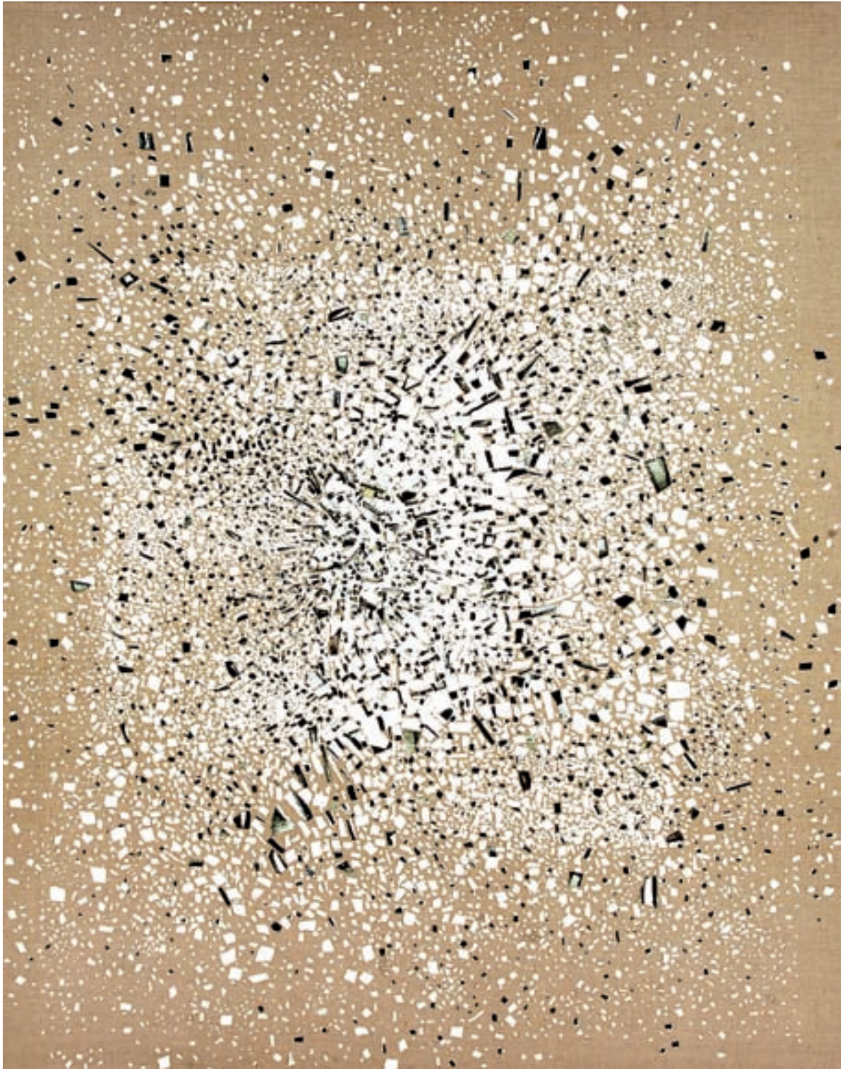
Fuencisla Francés. Obertura , 2009. Suport de tela, collage d'oli sobre paper, 115 x 146 cm.