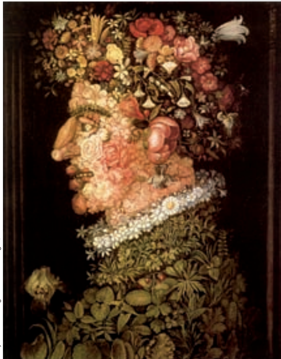
Giuseppe Arcimboldo. La primavera , sense data. Oli sobre fusta, 57 x 84 cm. En termes artístics, l'obra d'Arcimboldo podria comparar-se amb les tesis aristotelistes, divertides i enginyoses però del tot producte de la imaginació.

Si el llibre de Copèrnic va passar sense pena ni glòria, els de Galileu –potser a conseqüència de la seua capacitat retòrica– despertaven sempre apassionades controvèrsies, i «esclats d'emocions». Comptat i debatut, les tesis dels aristotelistes recordaven les creacions d'Arcimboldo, divertides i enginyoses, però extravagants i del tot producte de la imaginació. No hi havia comparació possible entre l'obra d'un pintor il·lustre (el seu amic Cigoli) i les extravagàncies del ingegnosissimo Arcimboldo. Una cosa és pintura, i l'altra és un divertiment, un acudit: Arcimboldo no ocuparà mai cap lloc en la història de la pintura, cap lloc preponderant s'entén. Els aristotelistes eren arcimboldians (falsos pintors), mentre que els que llegien l'idioma de la natura eren els vers pintors (els autèntics científics), els que tenien possibilitats d'accedir a la veritat, al perquè de les coses.