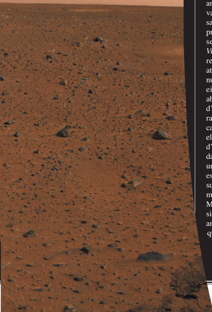
Primera imatge en color del rover Spirit , obtinguda per la seua càmera panoràmica. S'hi pot veure el típic paisatge marcià d'arena taronja esguitada per roques, sota un cel rosa.

jançant la mesura de neutrons solars que reboten de la superfície) grans quantitats d'hidrogen (possiblement aigua en forma de gel), a pocs metres de profunditat.