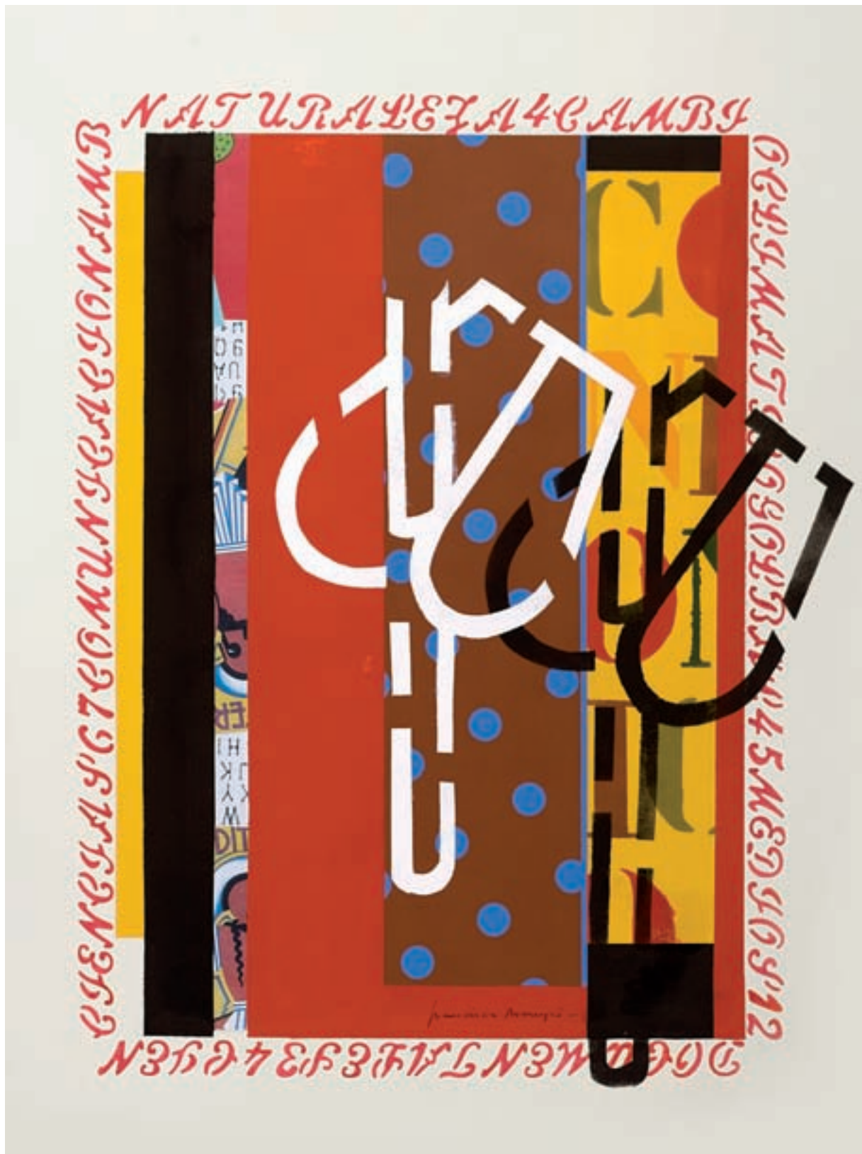
Francisca Mompó. Doble fulla , 2010. Sèrie «Botànic». Guaix, collage sobre paper, 70 x 100 cm.