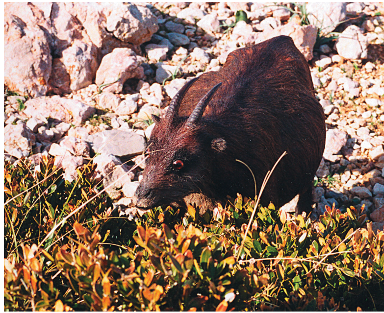
Model de Myotragus balearicus en el seu ambient natural. L'espècie podia menjar boix ( Buxus balearica ), una planta que resulta tòxica per a la majoria d'artiodàctils.

Entre els mamífers, a més dels casos esmentats d'elefants nans, perososos insulars i Bibymalagasias, es coneixen casos extrems d'evolució insular a les illes