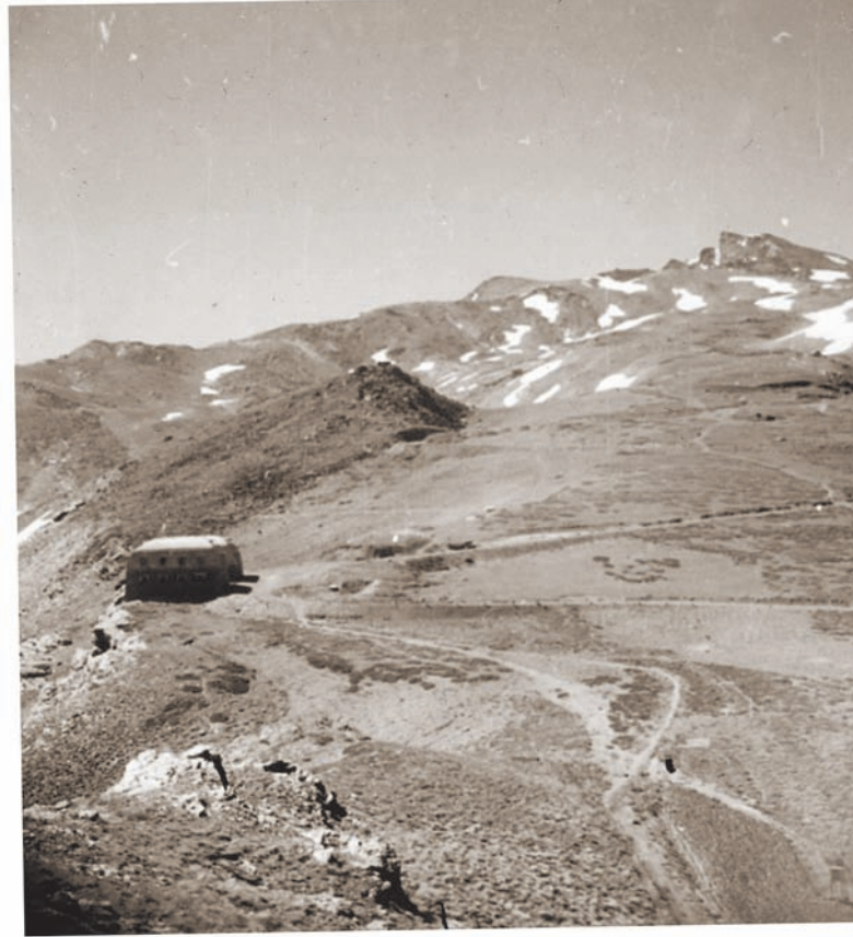
Sierra Nevada, amb la seua rica flora, ens va cridar i vam emprendre el viatge amb cotxe muntanya amunt per la carretera tortuosa, la més alta d'Europa, fins a l'alberg en Los Peñones de San Francisco, just per davall del pic de la Veleta (3.398 m).

De Granada ens vam dirigir al sud, a la costa subtropical de Motril i vam travessar Almeria, fins arribar a Múrcia, on vam pujar la serra de Carrascoy i hi vam trobar Thymus murcicus , pertanyent a la secció Pseudothymbra d'aquest gènere que era molt semblant a la T. membranaceus i estretament emparentat amb T. longiflorus (timó de flor llarga) que vam veure a Sierra Nevada. Més tard vam topiar amb el rar T. funkii fora de Sant Miquel de Salines. Aleshores el nostre viatge ens va dur a Xàtiva, on vam ascendir els vessants del castell buscant Lapiedra martinezii , i a València, on vaig conèixer l'orxata. El nostre viatge a Espanya va acabar a Catalunya, on vam arribar a Igualada i ens vam afegir al pelegrinatge cap als cims punxeguts de Montserrat i vam agafar el funicular més amunt del monestir fins al cim, on, en la dura roca basàltica, eren freqüents la Saxifraga catalaunica i l' Erodium supracanum i, més enllà dels boscos de boix, les flors rugoses del Ramonda myconi . Un agradable viatge d'un dia en cotxe ens va dur a la frontera de la Jonquera. La