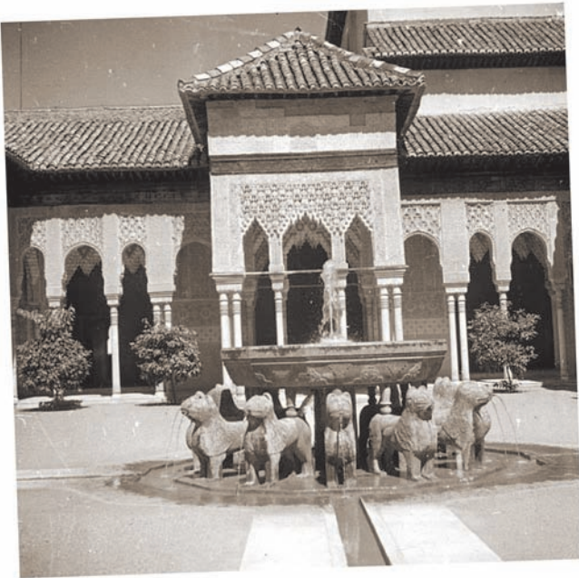
Patio de los Leones, Alhambra, Granada 1948. No resulta difícil imaginar la impressió que el fabulós palau de l'Alhambra i els jardins del Generalife, amb els pics coberts de neu de Sierra Nevada en la distància van causar en aquell estudiant de vint anys.

Salto de los Órganos, dominat pels seus cims com uns tubs d'orgue. Forma un arbust menut amb rosetes terminals de fulles platejades en forma d'espàtula i grans capítols de vistoses flors blanques en abundància. Mentre els nostres guies feien la migdiada a l'ombra, jo em vaig dirigir cap al fons del barranc a ple sol i allà, des del llit del riu, sota els torrents d'aigua que queien en cascada, veia les fulles platejades i el rizoma negre temptadorament fora de l'abast en les parets de roca calcària. En aquella època en el camp es calçava botes d'escalada adequades, amb claus d'alpinista, i no botes de sola de goma o sabatilles, i així, ajudat per una vella branca i ascendint amb dificultat per les roques, vaig aconseguir fer caure uns quants capítols amb fruit dels quals vam extraure llavors que més tard es van cultivar en el Reial Jardí Botànic d'Edimburg i van créixer en el cèlebre jardí de roques.