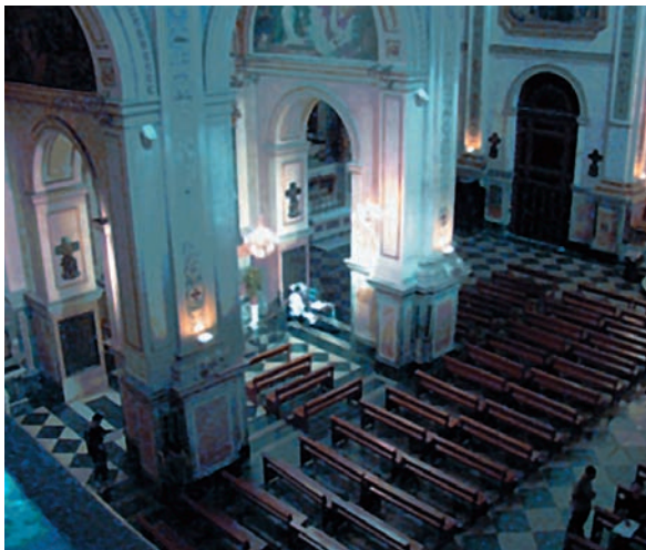
Dalt, dues fotografies de l'interior de l'Església del Sagrat Cor de Jesús. Corresponen a la nau central de l'església, que és on es va obtenir el radargrama.

estem analitzant. Metafòricament, és com si gaudírem d'unes ulleres que posades als nostres ulls ens permetessin veure diferents colors per a diferents capes del subsòl o objectes soterrats. Però encara ens plantegem obtenir més informació d'aquesta «visió» acudint a les nostres estimades equacions científiques. En certa manera, reforcem el sentit de la visió amb les nostres eines físiques i matemàtiques per tal d'arribar a conclusions que siguin útils en algun camp del coneixement, per tal que la nostra investigació sigui realment aplicada.