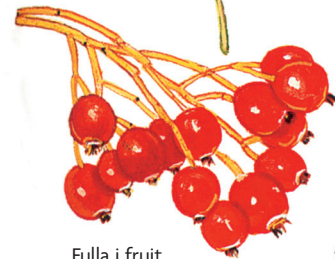
Fulla i fruit de server