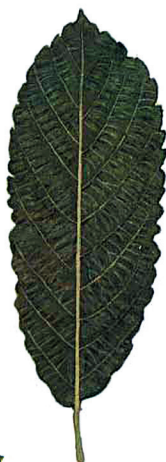
Fulla de salze