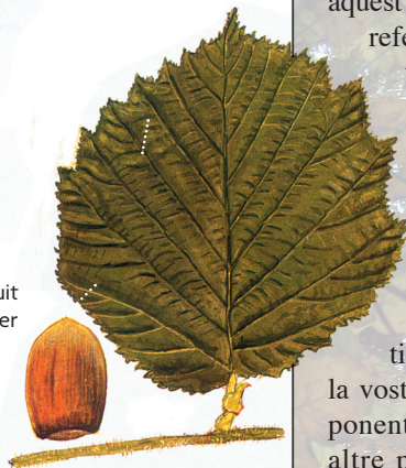
Fulla i fruit d'avellaner