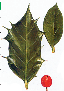
Fulla i fruit de grèvol