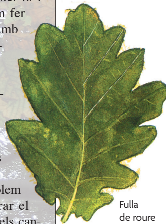
Fulla de roure

Els arbres en vermell es troben al Jardí Botànic de la Universitat de València.