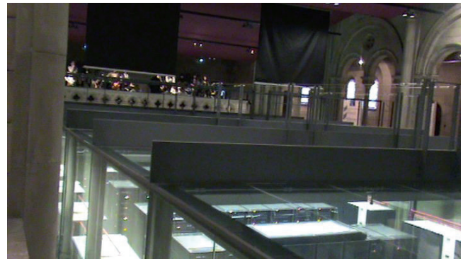
FIGURA 1. Esquerra, grup de recerca amb les estudiants d'ESO i les guies universitàries. Dreta, visita al supercomputador MareNostrum, l'únic d'aquest tipus a Europa durant anys.

Campus Nord de la Universitat, amb assistència a classes «a mida» i compartint experiències amb dones universitàries (estudiants i professores). El grup va ser seleccionat d'un centre de secundària i totes les alumnes estaven seguint un curs tècnic (encara que no totes estaven pensant a seguir una carrera tècnica).