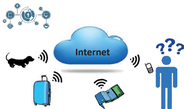
FIGURA 1. En un futur proper, milions d'objectes quotidians incorporaran un sistema electrònic encastat amb capacitat d'interconnexió mitjançant Internet.