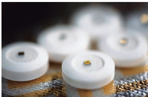
FIGURA 4. Els xips submil·limètrics ingeribles incorporats a les pastilles podrien proporcionar dades de camp molt valuoses a les indústries farmacèutiques.

La revolució dels xips amb elements microelectromecànics integrats (MEMS) ha representat un nou paradigma en el disseny de sistemes encastats. Amb aquestes tecnologies, alguns dels elements mecànics o electromecànics es poden integrar a escala micromètrica dins dels xips. Gràcies a aquestes tecnologies hi ha disponibles en el mercat dispositius anomenats smart sensors (senyors intel·ligents). Aquests xips smart sensors estan dotats de capacitats sensorials per a adquirir dades de l'ambient i transmetre-les per ràdio o, fins i tot, amb capacitat per a actuar (nanorobòtica). En la figura 4 es mostra una versió dels xips smart sensors incorporats en píndoles que permetran a les farmacèutiques comprendre millor el procés d'absorció dels medicaments gràcies a un volum massiu de dades provinents de milers d'usuaris.