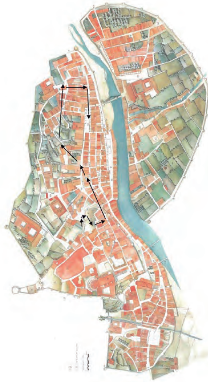
FIGURA 2. Recorregut de la processó de Sant Narcís. Plànol dels burgs de Sant Pere de Galligants, Sant Feliu, la Força Vella i de l'Areny i Vilanova de Girona. S'indica el recorregut des de la seu fins a l'església de Sant Feliu.

que tenien resposta per part de la capella de cantors. Es continuaven cantant una sèrie d'himnes que, primer, entonaven els xantres i que eren contestats per la resta de la capella o per l'orgue. També hi havia joglars, «musicis vulgariter dictis» que esperaven al cap de l'escala mentre arribava una imatge de la Verge Maria. Llavors els xantres entonaven una antífona dedicada a la Verge que es repetia, si era menester, fins que el bisbe arribés a l'altar major. La processó parava a la plaça de Sant Feliu, passant per la plaça de les Cols i per la plaça del Vi, on es cantava un motet en honor a sant Narcís. 12 El recorregut que feia la processó de Sant Narcís el 18 de març era el següent: