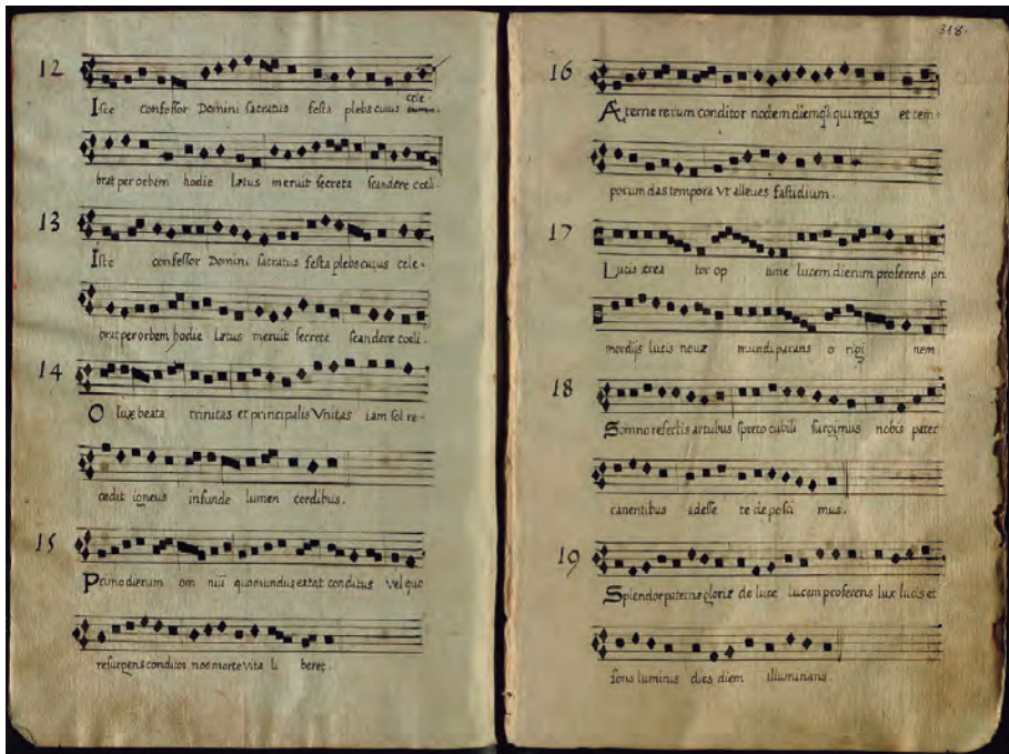
FIGURA 3. Exemples de cant pla (himnes) de la Consueta de 1595-1655, f. 317v-318r.

En cas que la festa coincidís en segon, tercer o quart diumenge, es feia com si fos un diumenge ordinari amb les convenients vespres i la novena lectura de l'homília i l'evangeli del diumenge. Acabada la missa es feia la processó. Si coincidia en diumenge de Passió, es traslladava al següent dia que es pogués, tot i que no es traslladava la processó, que es feia el mateix diumenge. Si queia en diumenge de Rams, es feia després del primer diumenge de Resurrecció. Els himnes fins a l'església de Sant Feliu es cantaven amb música pròpia del temps de Pasqua. 13 En la Consueta trobem les diferents melodies litúrgiques de cant pla que sonaven en cada una de les festivitats: himnes, antífones i salms —vegeu en la figura 3, per exemple, uns himnes de la Consueta de 1595-1655 amb notació musical.