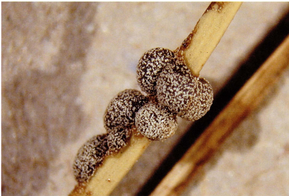
Lepidoderma carestianum (Rabenh.) Rostaf., BCN: 12143.