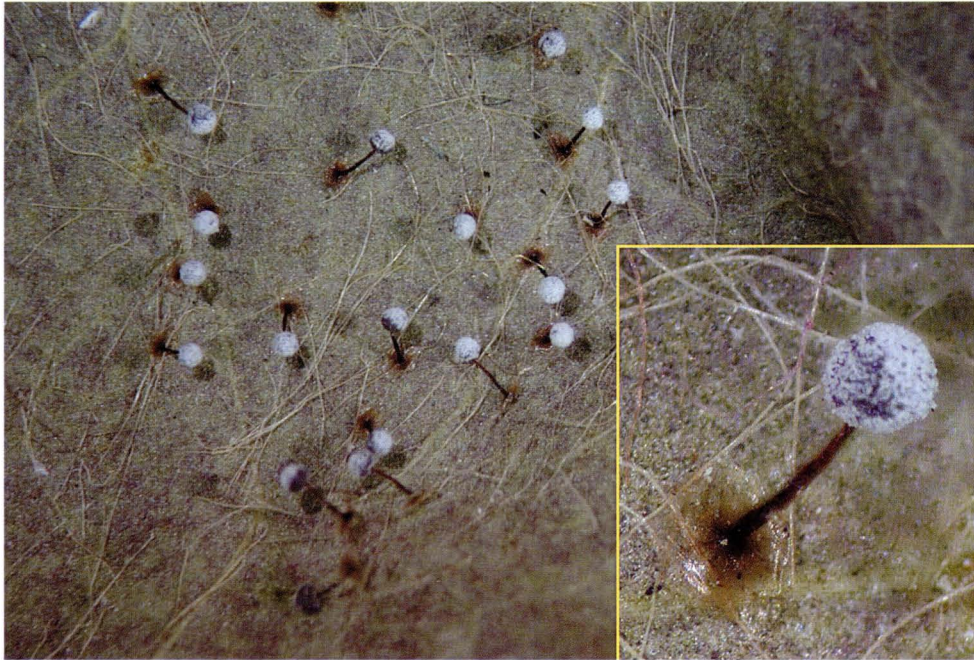
Didymium nigripes (Link) Fr., BCN: 12321.