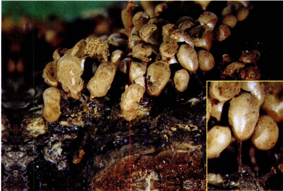
Arcyria minuta Buchet in Pat., BCN: 12115.