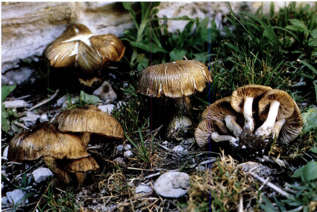
Entoloma clypeatum (L.) P. Kumm. var. defibulatum Noordel.