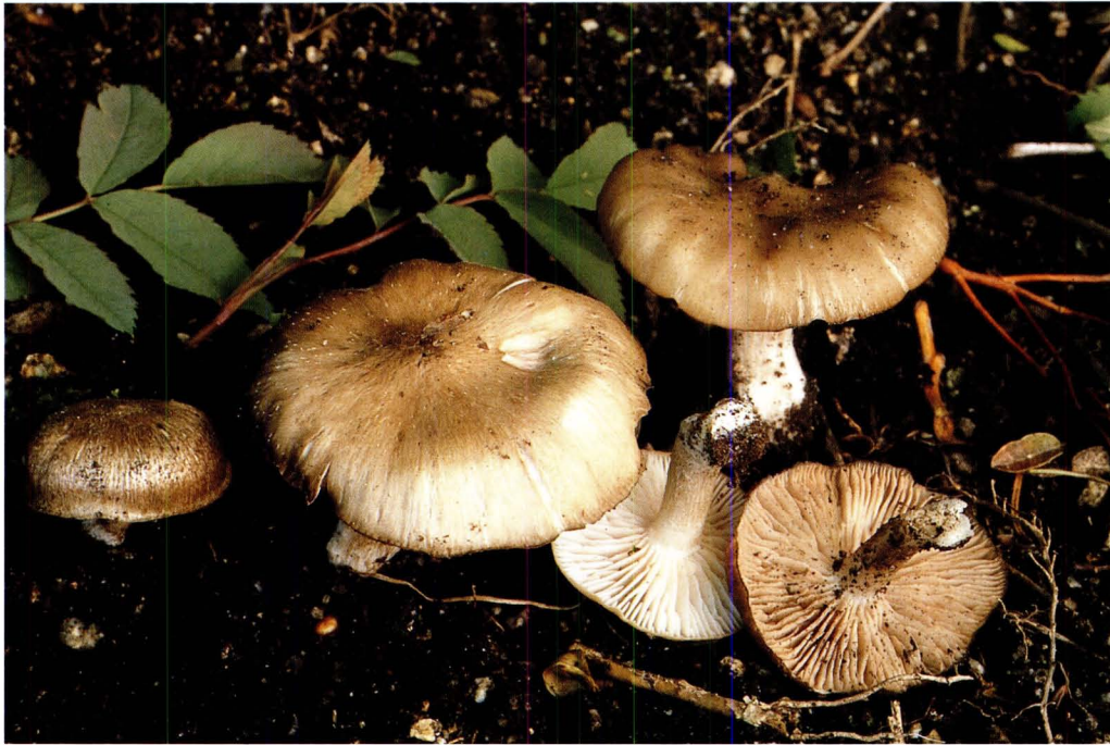
Entoloma clypeatum (L.) P. Kumm. var. defibulatum Noordel.