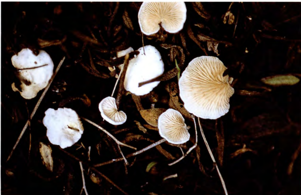
Crepidotus variabilis (Pers.) P. Kumm. var. trichocystis Hesler & A.H. Sm.