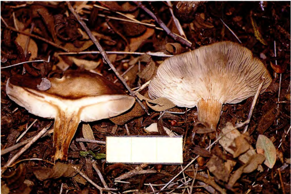
Melanoleuca langei (Boekhout) Bon