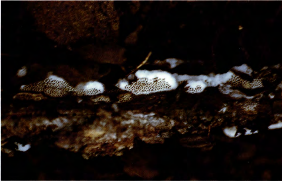
Antrodia ramentacea (Berk. & Broome) Donk