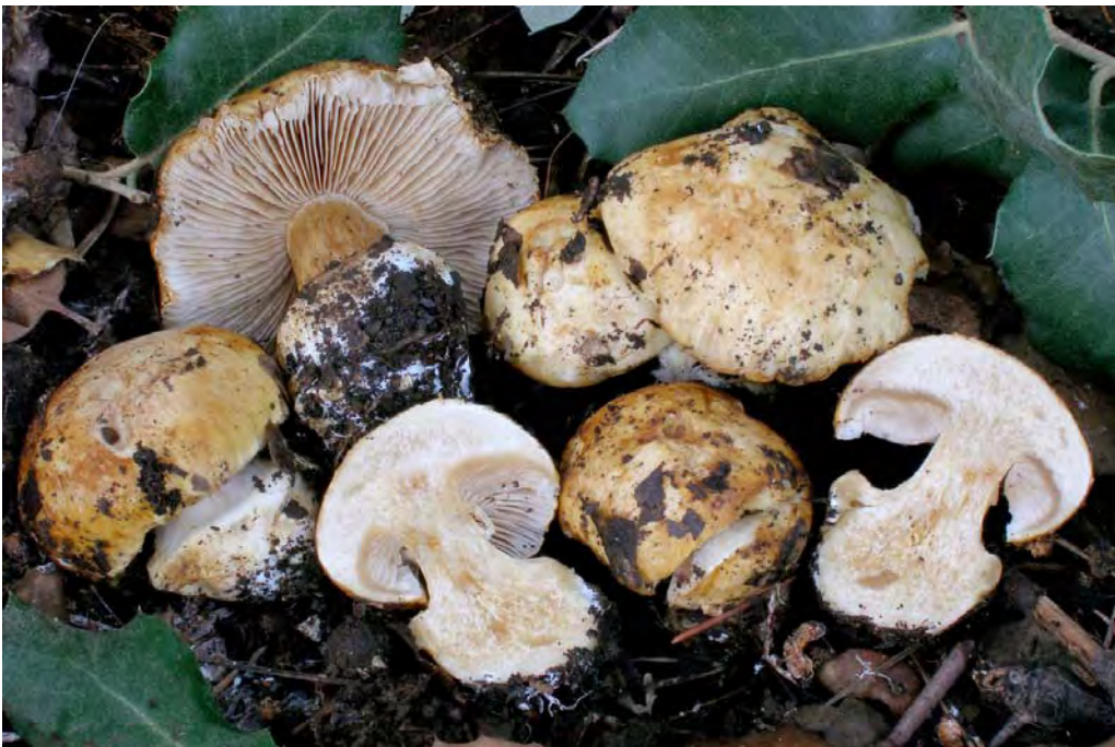
Cortinarius rioussetorum Bidaud, Moëgne- Locc. & Remaux