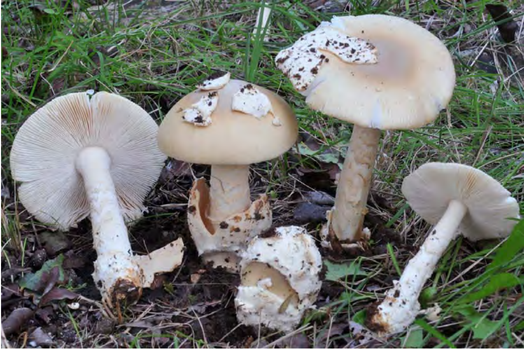
Amanita dryophila Consiglio & Contu