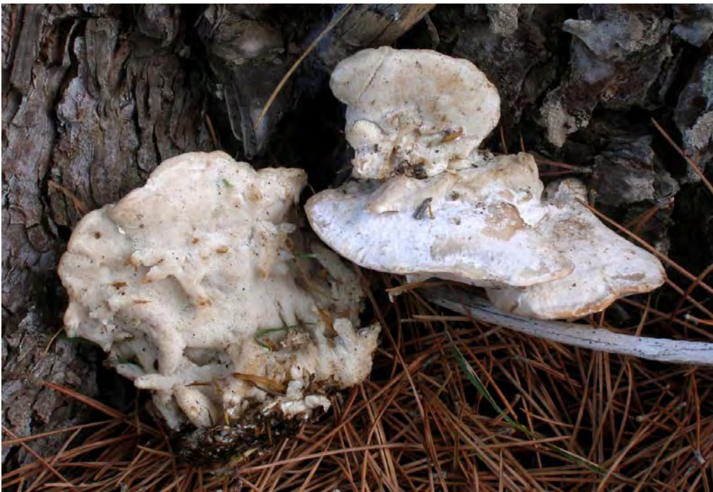
Fomitopsis iberica Melo & Ryvarden