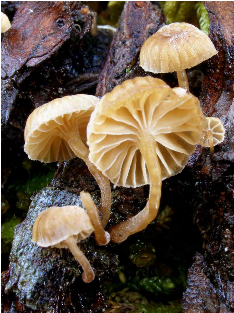
Mycena juniperina Aronsen