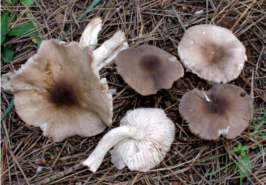
Dermoloma atrocinerum (Pers.) P.D. Orton