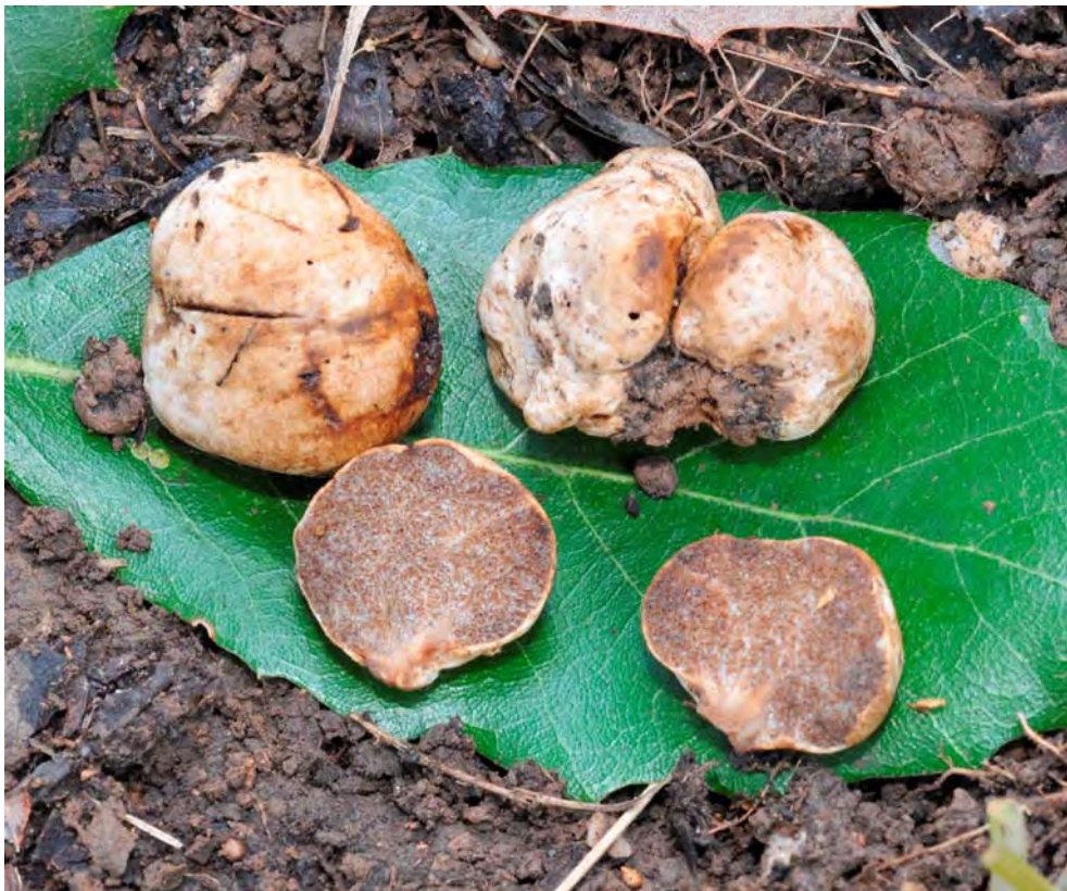
Hymenogaster populetorum Tul & C. Tul.