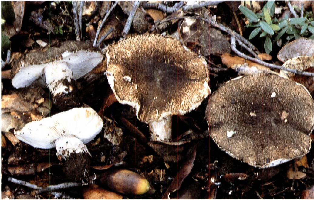
Lepiota andegavensis Mornand