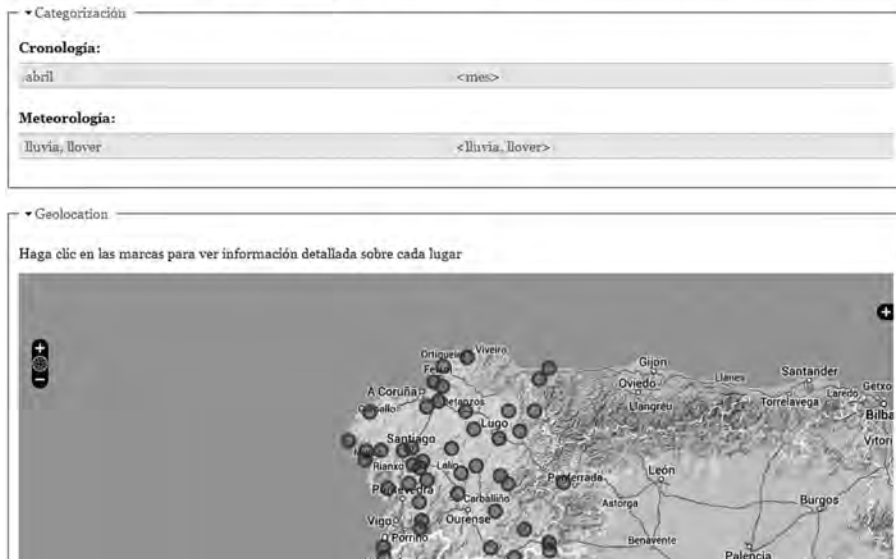
Figura 5. Ficha del conocido refrán En abril augas mil , en que se constata su vitalidad en el territorio gallego.

Paremiotipo localizado por el ALGa en más de cuarenta puntos de encuesta, con leves variaciones como encabezamiento con preposición ( En , Por ) o ausencia de esta, "gheads" ( aughas ) y otras. Cf. también Abril chuvias mil .